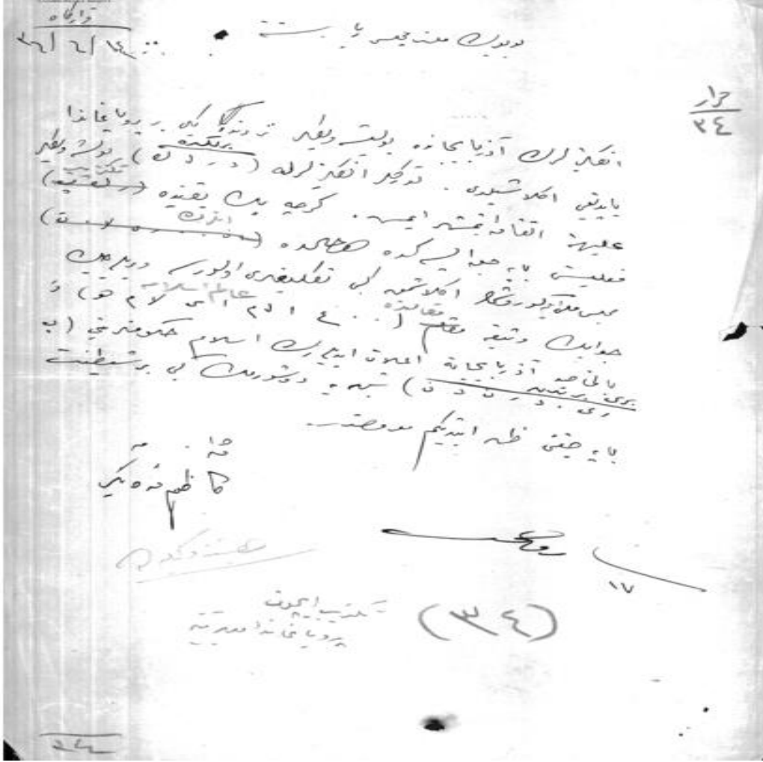
Kaynak: Cumhurbaşkanlığı Devlet Arşivleri Başkanlığı Cumhuriyet Arşivi (BCA). (1920). Fon: 30.18.1.1. Yer no: 1.2.16