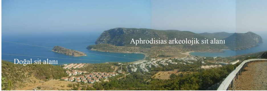
Resim 1: Aphrodisias Arkeolojik ve Doğal Sit Alanında İkinci Konut Gelişimi; Yeşilovacık, Mersin (Naycı, 2007)

Kitlesel turizm hareketlerine servis vermek üzere ‘Kamu yararı’ kapsamında yapımına izin verilen havaalanı, karayolu, yat limanı, arıtma tesisi gibi pekçok altyapı ve ulaşım projeleri kıyıların doğal ve arkeolojik özelliklerine zarar vermiştir.