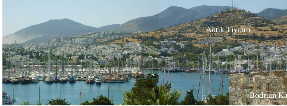
Resim 2: Bodrum Kent Merkezinde İkinci Konut Gelişmeleri ile Artan Yapılaşma ve Halikarnassos Arkeolojik Sit Alanı Üzerindeki Baskıları (Naycı, 2007)

1980’li yılların ikinci yarısından sonra belirlenen turizm hedef ve ilkeleri kapsamında ‘koruma stratejileri’ ile turizm gelişme stratejilerinin entegrasyonu’ ve de ‘bazı alanların korunarak turizm amaçlı gelişmeye açılması’ yaklaşımları sonucu ortaya çıkan özel çevre koruma bölgesi ve Milli Park gibi üst ölçekli koruma bölgeleri turizm merkezlerinin yoğun olduğu Antalya ve Muğla gibi kıyı illerinde yoğunlaşmıştır.