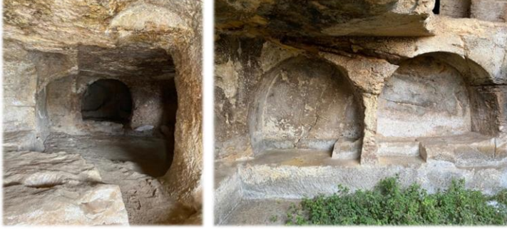
Fotoğraf 4-5. Yemek Törenlerinde yiyeceklerin yapıldığı ve pişirildiği bölüm.

Ölümünün 9. gününde mezarın önünde yemek töreni düzenlenir. Yemek sadece törene katılanlar için değil, mezara bırakılan yiyecekler ile daha sonra mezara gelen aç insanların beslenebilmesi içindir. Anma törenleri yılın belirli dönemlerinde yapılmaya devam edilir, yemekler düzenlenerek ölünün anısına libasyon yapılırdı. Kaya mezarlarında yemek hazırlamak için olduğu tahmin edilen ve ateşin yakıldığı ocaklar yer almaktadır.