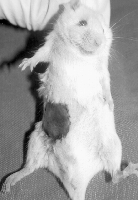
Şekil 2: BALB/c cinsi fareye C57BL/6 cinsi fareden transplante edilmiş viabl vaskülarize cilt allogrefti (donör: 25 gr., alıcı: 30 gr., Csa tedavisi altında, p.o 3. gün)

model olagelmıştır 23-25 . (Şekil 3) Yanısıra, vaskülarize cilt flepleri 26-28 ve cilt greftleri de 29 sıklıkla kullanılmaktadır. Kompozit dokunun içerdiği dokuların değişik şiddette ve zamanlarda reddedildiği bilinmektedir 4 . Her bir doku komponentinin rejeksiyonu ve tolerans indüksiyon mekanizmalarıyla ilgili yeni kompozit doku modelleri ortaya çıkmıştır. Örneğin kaymerizmin allograft yaşamına etkisiyle ilgili deneylerde kullanılmak üzere kemik iliği ve hematopoietik hücrelerin sürekli sağlanabilmesi amaçlı vaskülarize sternum ve femur allotransplantları tarif edilmiştir 30,31 . Ancak transplante edilen kemik iliğine ait tüm hücrelerin zamanla eliminasyonu ve donör kemik iliğinin alıcı hücrelerince replasmanının gösterilmesinden sonra vaskülarize kemikler popülaritesini yitirmiştir 32 . Yine sıçanlarda arka bacak transplantının komponentleri olan vaskülarize kas 36 , vaskülarize kemik ve eklem 37-39 ve periferik sinir allotransplantasyonu 40-42 ile yapılan laboratuvar çalışmaları da bulunmaktadır.