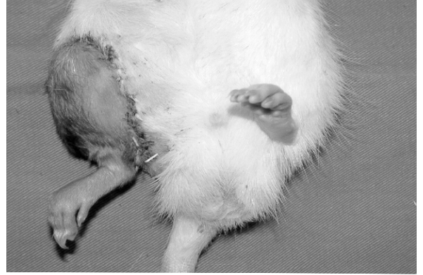
Şekil 3: Lewis cinsi sıçana Brown Norway cinsi sıçandan transplante edilmiş viabl arka bacak allogrefti (donör: 250 gr., alıcı: 250 gr., Csa tedavisi altında, p.o 3. gün)

Sıçanlarda kullanılan diğer bir model heterotopik larinks ve trakea transplantasyonudur. 1998'de Cleveland Clinic'teki başarılı larinks