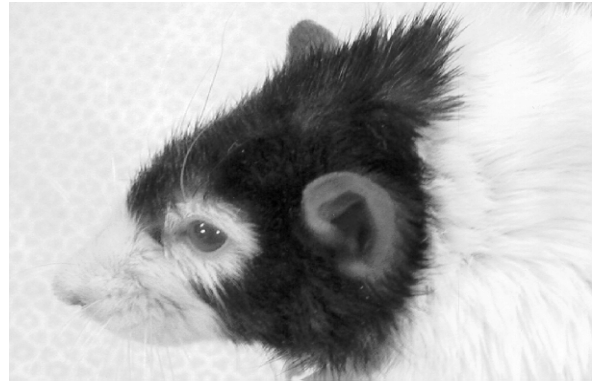
Şekil 4: Lewis cinsi sıçana Lewis Brown Norway cinsi sıçandan transplante edilmiş yüz ve skalp allogrefti ( donör: 250 gr. alıcı: 300 gr., Csa tedavisi altında p.o 100. gün)

transplantasyonunun ardından heterotopik larinks ve trakea 33-35 transplantasyon toleransı için laboratuvar çalışmaları devam etmektedir.