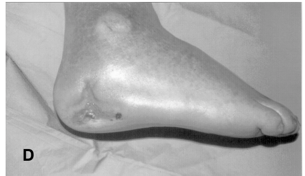
Şekil 1A: 68 yaşında TipII diyabetli, distal nabızları alınamayan ve ağır nöropatili olgunun, topuk posterolateralinde 4 aydır iyileşmeyen yarasının başvuru anındaki görünümü B: seri debrütmanlar ve fizyolojik pansumanlar sonrası görünüm C: Sesta-MIBI perfüzyon sintigrafisi, burada yara olan ayaktaki tutulum artışı dikkat çekicidir D: Kısmi kalınlıklı deri grefti ile onarım sonrası görünüm

ile kronik yaraların iyileşme potansiyelleri ve prognozlarının değerlendirilmesinde kullanılabilir. Bununla birlikte, sınır değerlerin belirlenebilmesi için çok merkezli ve çok denek sayılı çalışmaların yapılması gereklidir.