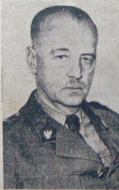
Polonya hükûmeti Basvekili General Skorski

Leh sefiri ve sefaret erkânı dün Moskovadan ayrıldılar