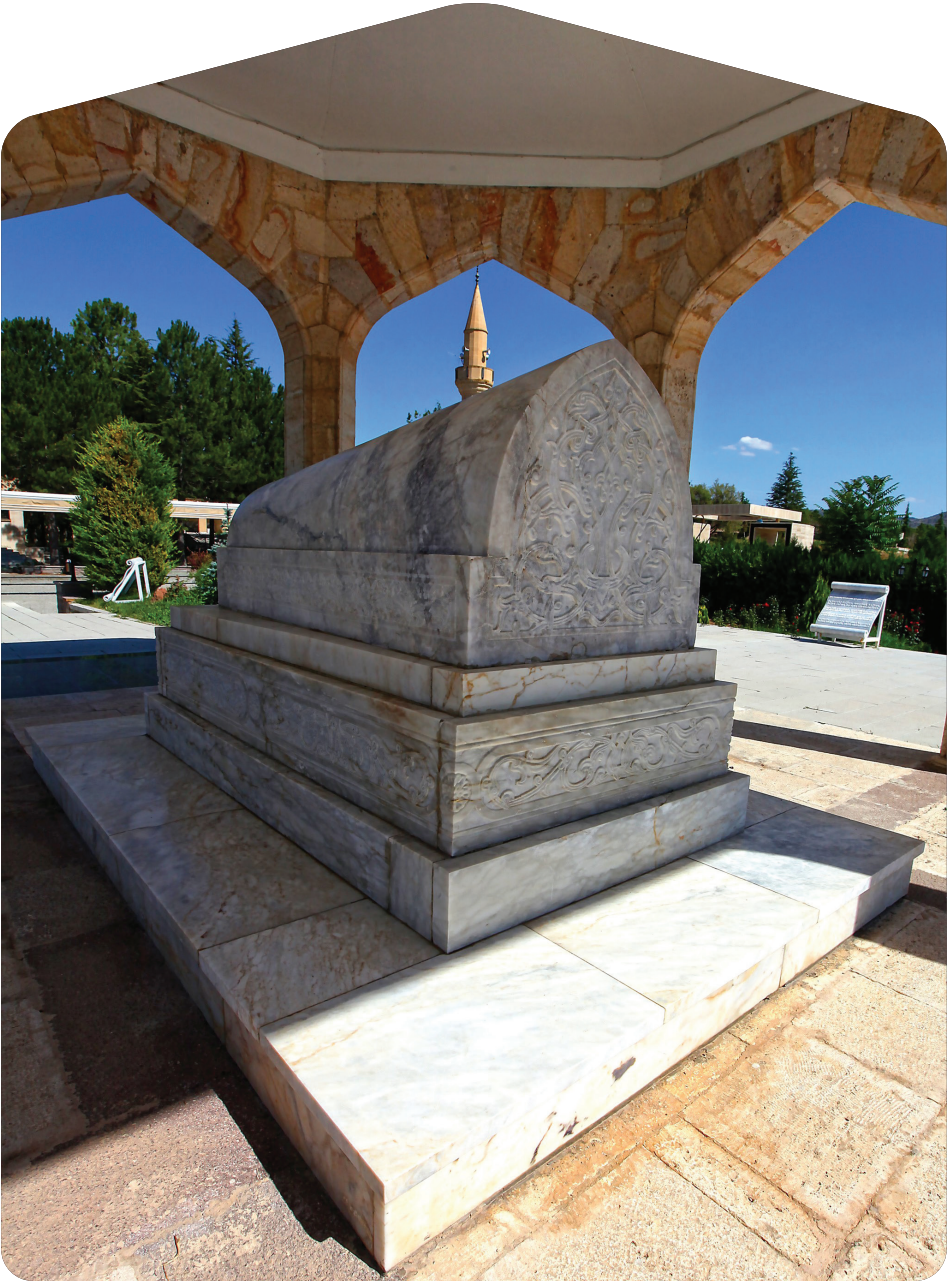
Yunus Emre Türbesi – Mihaliçik

Bektaş-ı Veli, Yunus Emre, Mevlana, Ahi Evran gibi ulularımız var. Keza Ahi Evran da çok önemli, iktisadi hayatı düzene sokan aynı çağ. Yunus bu çağda çıktı ve bu dönemde insanlara söylediği şeyi, aslında bu dönemde modern insana da aynen söylüyor: "Tamam, sıkıntılar yaşıyoruz arkadaşlar, haklısınız. Mütemadiyen bu sıkıntıları söylemek, dertleri söylemek yarayı kaşımakla yara tedavi olmuyor. O zaman yarayı tedavi etmenin içimizdeki o kanayan, akan kanı dindirmenin ruh dünyamız-