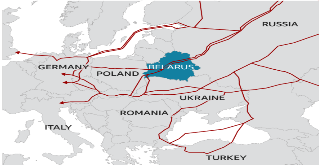
Harita 3. Beyaz Rusya'dan Geçen İki Temel Boru Hattı Güzergâhları (BBC, 2021)

Enerji konusunda ilk dikkat edilmesi gereken, Beyaz Rusya'nın Rusya bağımlılığıdır. Ülke, büyük ölçüde Rusya'dan her tür fosil yakıt ithal etmektedir ve dünyanın en büyük doğal gaz ithalatçılarından biridir. Beyaz Rusya ham petrol ithal etmekle birlikte, Rusya, Beyaz Rusya'da rafine edilen ham petrolün ana tedarikçisidir (IEA, 2020)