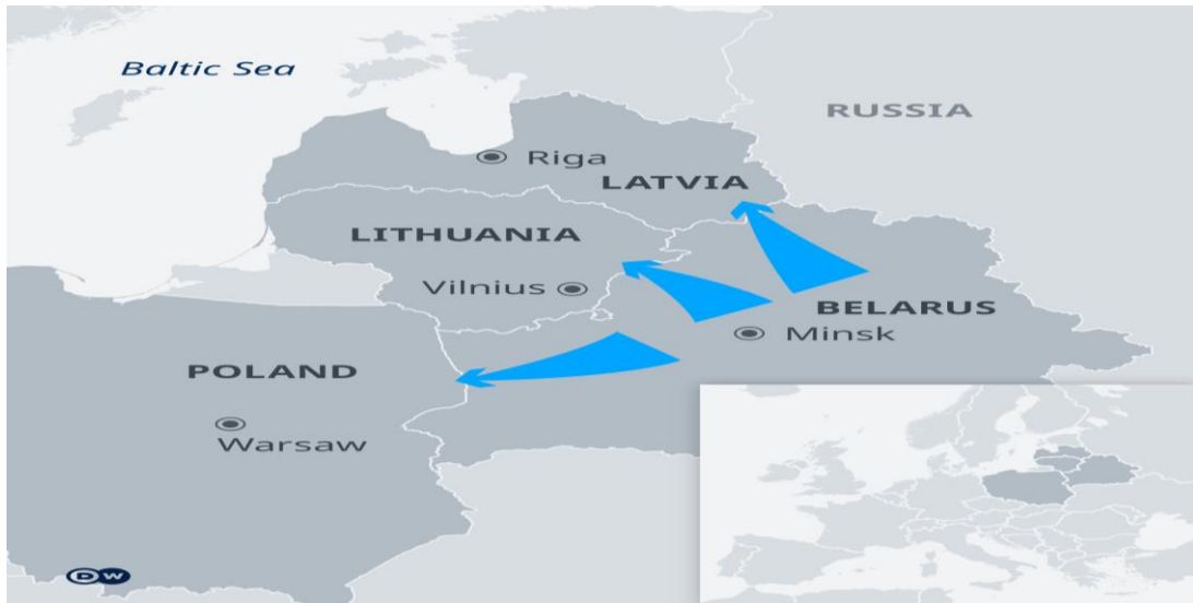
Harita 2. Beyaz Rusya'dan AB'ne Gc gzergahları (Kinkartz, 2021)

AB'ye karřı uygulanan bu gc politikasının temel sorunu 2010'dan bu yana pek ok gc dalgasının aksine bu gc dalgasının “yaratılmıř” olması. Beyaz Rusya AB'nin yaptırımlarına karřı gc bir koz, bir dıř politika aracı olarak kullanarak zerindeki baskıyı kaldırmak/azaltmak istemesi de temel motivasyon nedenidir. zellikle Ekim 2021'de Beyaz Rusya'nın AB ile gcmenleri geri almak anlařmasını askıya almasına ynelik kararı sınır gvenlięi konusunda Harita II' de grldę gibi Litvanya, Letonya, Polonya bařta olmak zere AB'nin siyasi bir savařı haline gelmiřtir (ECRE, 2021). AB'de buna karřılık adımlar atmaktadır. Frontex Direktr Fabrice Leggeri Polonya-Belarus sınırını ziyaret etmiř ve Beyaz Rusya'nın hibrit eylemlerine (hybrid attack) karřı koymak iin sınır gvenlięini saęlamak adına adımları incelemiřtir (FRONTEX, 2021). Ayrıca Avrupa Halk Partisi Bařkanı Donald Tusk da Harita II'de ilk gcmen dalgaların ile karřılařan ve sınır gvenlik sorunları yařayan Polonya ve Litvanya'ya tam dayanıřma iinde olmalarına dair aęırıda bulunmuřtur (DWa, 2021). Ancak gc konusu pek ok entegrasyon sorununu iinde barındırdıęı iin ilk ařamada AB'nin bu konuya dair daha somut adımlar atması da gereklidir. Ancak son noktada AB'nin hibrit eylem ve savař konusuna tam anlamı ile uyum saęlayamadıęı dřnlebilir.