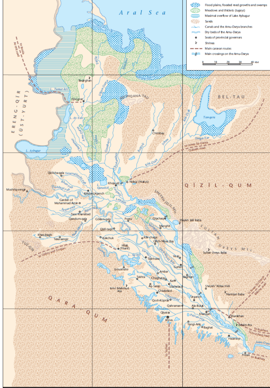
XVIII-XIX. Yüzyillarda Harezm Bölgesi Haritası (Bregel 2003: 67)