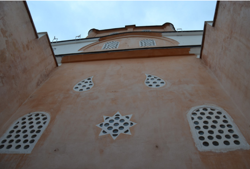
Fotoğraf 21: Kapatılan yıldız formlu açıklığın güney cepheden görünümü.