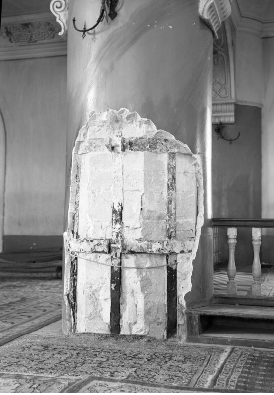
Fotoğraf 27: Ayaklarda sıva sökümü sonrası ulaşılan sekizgen gövde ve lamalar.