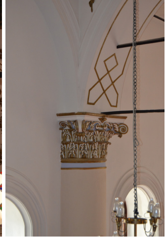
Fotoğraf 28-29: Serbest ve gömme ayakların başlıklarından ayrıntılar.