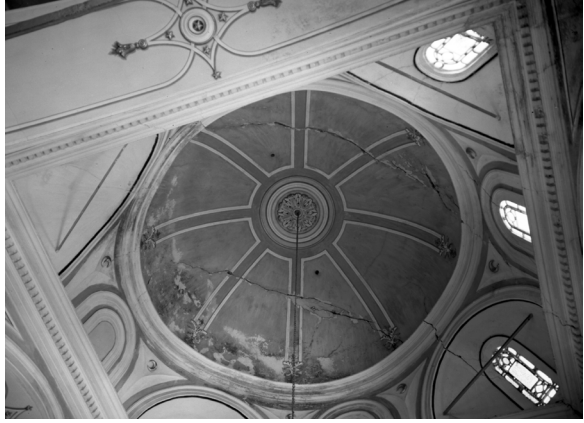
Fotoğraf 30: 1977 depremi sonrası kubbe içindeki çatlaklardan bir görünüm.

Vakıflar Genel Müdürlüğü'nün 1980 yılına ait fotoğraflarında, minberin doğu ve batı aynalıklarındaki çiçek kabartmalarının, birer Mühr-ü Süleyman motifiyle çevrelendiği görülmektedir. Günümüzde mevcut olmayan bu motiflerin 1982-1985 yıllarındaki onarımlarda kazınarak ortadan kaldırıldığı anlaşılmaktadır. (Fot.31)