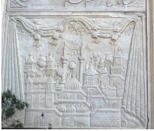
Fotoğraf 14: Dönertaş Sebili kuzey cephesindeki süslemelerden ayrıntı.