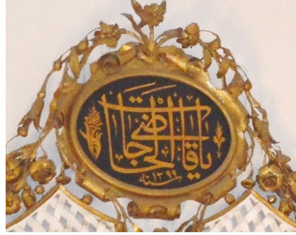
Fotoğraf 17-18: Doğu ve güney duvarlarındaki ayet panolarından ayrıntı.

Güney cephede, mihrap nişi üzerinde yer alan ve günümüzde yalnızca dışarıdan görülebilen sekiz köşeli yıldız formundaki pencerenin de 1881 yılında mihrabı kuşatan mevcut süslemeler eklenirken kapatılmış olması muhtemeldir. İzmir I Numaralı Kültür ve Tabiat Varlıklarını Koruma Bölge Kurulu’nun 30.07.2009 tarih, 4276 sayılı kararında, raspalama işleminin ardından ortaya çıkan bu açıklığın korunması istenmiştir 46 . (Fot.19-21)