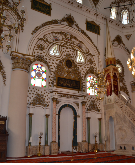
Fotoğraf 19: Mihrap duvarındaki alçı süslemelerden genel bir görünüm.