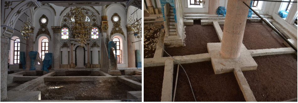
Fotoğraf 32-33: 2018-2019 onarımlarından genel bir görünüm.

2018 yılında, kadınlar mahfilinin sehim yapması, mahfil tabanında yer alan sıvaların dökülmesi ve kısmi kopmalar oluşması sonucunda, basit onarım kapsamında müdahaleye ihtiyaç duyulmuştur. Müdahale kapsamında, mahfilin sehim yapmasının statik nedenlere bağlı olup olmadığını anlamak üzere, zeminde temel araştırmaları yapılmasına karar verilmiştir. Yapılan temel araştırmalarında, 1982-1985 yıllarındaki onarım çalışmalarında yapıya uygulanan betonarme ekler ve ayakların özgün durumu tespit edilmiştir.