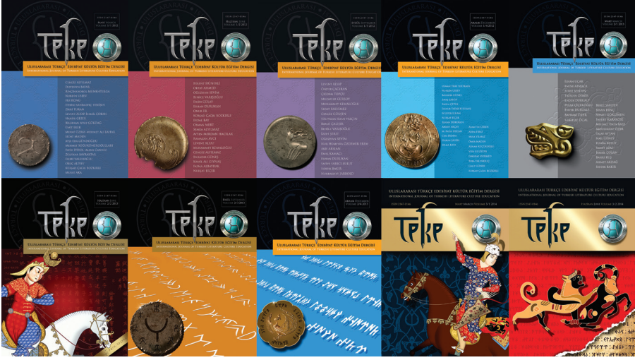
4. fotoğraf: Uluslararası TEKE dergisinin özenle hazırlanmış kapaklarını yansıtan görüntü.

Uluslararası TEKE dergisi http://www.tekedergisi.com/ adresinde elektronik olarak yayımlanan hakemli bir dergidir. Dergi, düzenli olarak üç ayda bir (Mart-Haziran-Eylül-Aralık) yayımlanmaktadır. Derginin bugüne kadar 11 sayısı ilgililerinin istifadesine sunulmuştur.