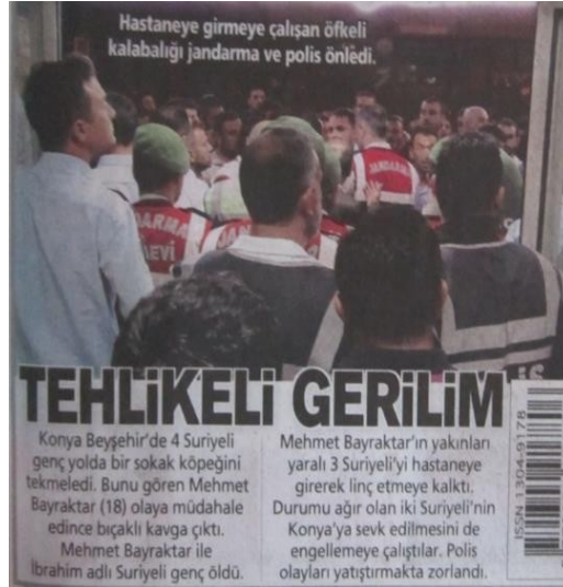
Resim 8: Haber 8, Posta Gazetesi (11.07.2016)

Haber Retoriği: Haberde kullanılan fotoğraflar haber bütünlüğüyle uyumludur.