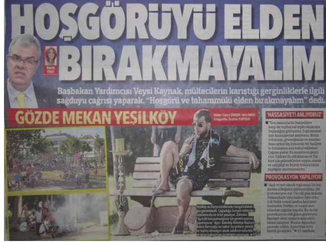
Resim 2: Haber - 2, Hürriyet Gazetesi (05.07.2017)

Haber Retoriği: Haberde kullanılan anne ve bebek fotoğrafı, haberde verilmek istenen düşünceye uyumlu şekilde kullanılmıştır.