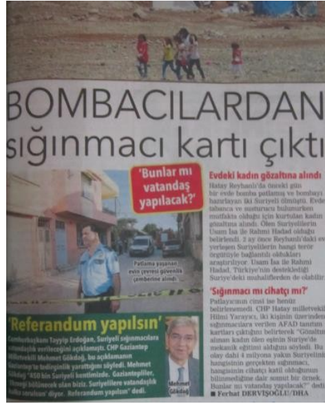
Resim 7: Haber 7, Posta Gazetesi (08.07.2016)