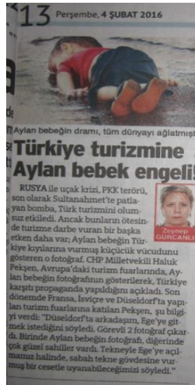
Resim 3: Haber 3, Sözcü Gazetesi (04.02.2016)