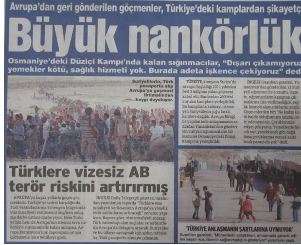
Resim 4: Haber 4, Sözcü Gazetesi (18.05.2016)