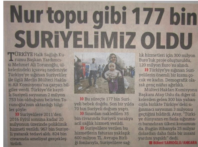
Resim 1: Haber 1, Hürriyet Gazetesi (15.11.2016)