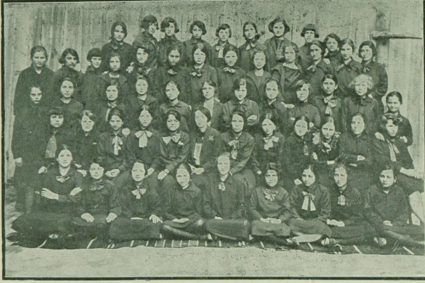
44 — قسطمونی قیز اورتا مکتبی طلبه سندن برغروب Elèves de l'Ecole moyenne de Kastamouni

( https://archives.saltresearch.org/handle/123456789/122986 , 12.03.2022)