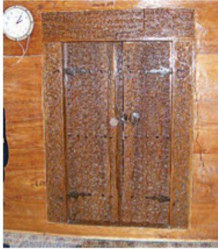
Fotoğraf 8: Çarşamba Kocakavak Köyü Camii Harim Girişi Kapı Kanatları (Eyüp Nefes)