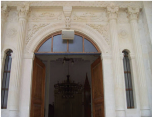
Fotoğraf 6: Ordu Atik İbrahim Paşa Camii Harim Girişi Süslemesi (Esin Özdemir)