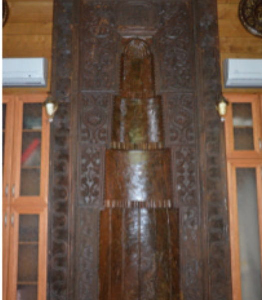
Fotoğraf 12: Trabzon Çamburnu Kuşluca Camii Mihrabı Süsleme (Yavuz Sarı)