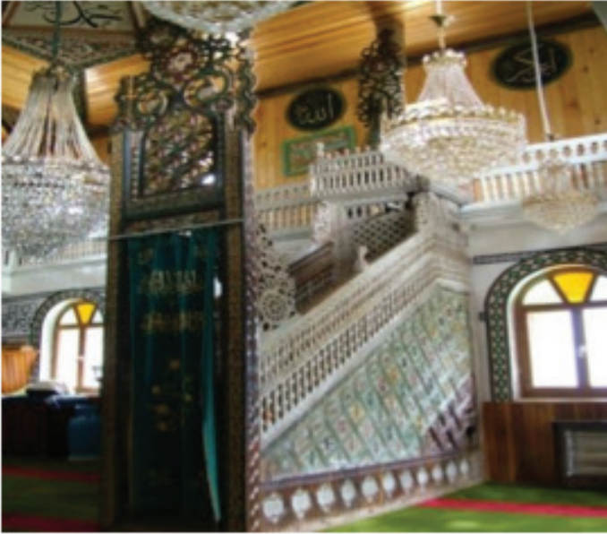
Fotoğraf 14: Trabzon aykara Taşören Camii Minberi (Mustafa Tuner)