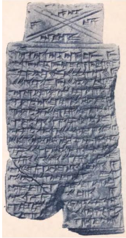
Fig. 2. Asur'da, Prens Sarayı'nda bulunan, KAR 35 no'lu ev muskası. (Panayotov, 2018: 193).