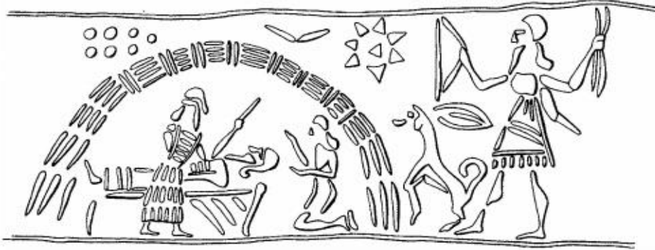
Fig. 4. Yeni Asur Dönemi'ne ait olan bu silindir mühürde, sazdan bir barınağın içinde bir din adamı hasta bir adamla ilgilenirken tasvir edilmiştir. (Black - Anthony, 2003: 97).