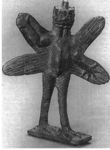
Fig. 1. İblislerin kralı olarak bilinen Pazuzu, diğer iblislerin aksine, koruyucu yönüyle dikkat çekmektedir. Onun heykelciklerinin koruyucu amaçlı kolye gibi takıldığı bilinmektedir (Wiggermann, 2011: 317). İblis Pazuzu bronz heykelciğinin önden görünümü, Yeni Asur dönemi, Oriental Institute, University of Chicago. (Farber, 1995: 1897).