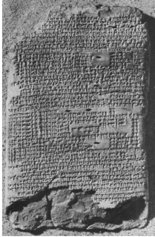
Fig. 3. BM 47753 no'lu epilepsi tableti. (Reynolds - Wilson, 1990: 187).