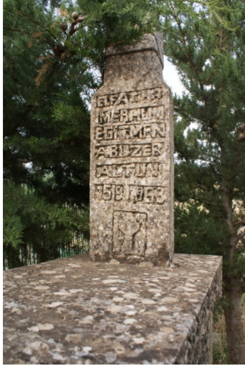
Şekil 10 : Abuzer Altun Mezarı Baş Şahide Mum Motifi

Baş şahidede dikkat çeken süsleme unsurlarından biri, mum motifine yer verilmiş olmasıdır (Şekil 10). Mezarda yatan kişinin eğitmen olmasından dolayı, öğretmen, bir mum gibi etrafını aydınlatır misali mezara işlendiği düşünülebilir. Ayrıca mum motifi, karanlığı aydınlatan bir figür olması itibarıyla, ahret yaşamını aydınlatıcı bir simge olabilir. Ancak mezarda yatan kişinin mesleğinin öğretmenlik olarak belirtilmiş olması, ilk fikrin kuvvetle muhtemel olduğunu düşündürmektedir. Kitabe metninin hemen altında yer alan mum, dikdörtgene yakın bir çerçeve içerisinde yer almaktadır. Silindirik şekilli mumun fitili yanar vaziyettedir ve ateşi, üçgenvari bir şekil halinde resmedilmiştir.