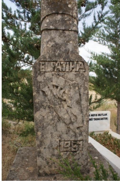
Şekil 8 : Mehmet Alp Mezarı Baş Şahide Kama ve Tabanca Motifi

Mezarın oldukça sade tutulan ayak şahidesi ise, yukarıda üçgen bir form ile sonlanmaktadır.