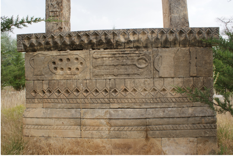
Şekil 11 : Hüsegün Akbağ Mezarı Güney Sanduka Yüzü