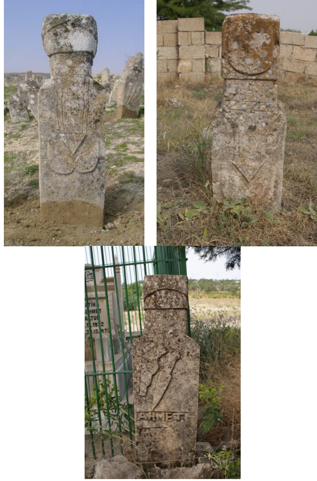
Şekil 16-17-18 : Besni Çevresi Mezarlıklarında Muska ve Tabanca-Kama Motifleri

dürmektedir 42 . Yöredeki vatandaşların ifadesine göre de tabanca, dönemin oldukça ünlü ve sevilen silahı olan Barabelli (9'luk) tabancaların mezar taşlarındaki bir yansımasıdır 43 .