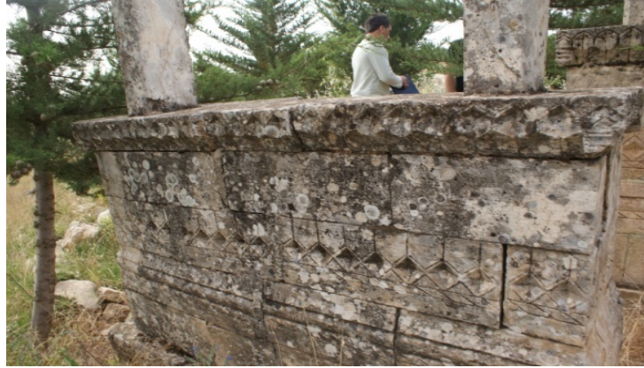
Şekil 2: Hacı Altun Mezarı Kuzey Cephesi