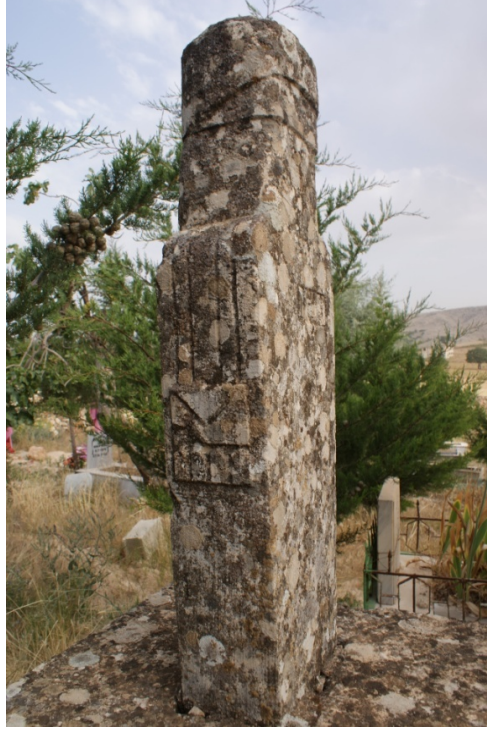
Şekil 6 : Hacı Altun Mezarı Muska Motifi