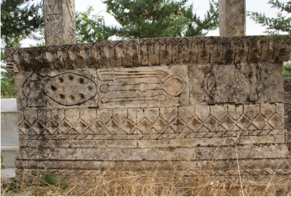
Şekil 7 : Mehmet Alp Mezarı Güney Sanduka

Baş ve ayak şahideli sahip bu mezarın sandukasının güney yüzünde, yine kahve yapımı ve sunumu ile ilgili süsleme unsurları bulunmaktadır. En üst kısmında, mukarnas yuvalarıyla oluşturulmuş dizinin hemen altında yer alan blok üzerinde, kapaklı bir cezve, fincanları işlenmiş bir tepsi, kahve kavurma tavası, maşa, eğiş, sürahi ve dibek çubuğu bulunmaktadır (Şekil 7). Diğerlerinden farklı olarak burada, tepsi içerisinde sekiz adet fincan görülmektedir. Sürahi ve dibek, yüksek kabartma tekniğiyle sergilenmiş iken, diğerleri alçak kabartma tekniğinde düzenlenmiştir.