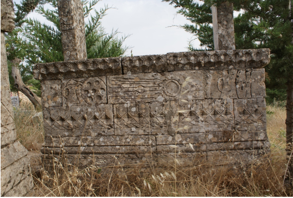
Şekil 3 : Hacı Altun Mezarı Güney Cephesi

Sandukanın kuzey yüzündeki taş sıraları, düzgün kesimli taşlardan oluşturulmuştur (Şekil 2). Tabanı oluşturan zemindeki ilk sıra, sade olarak ele alınmıştır. Bunun üzerinde yer alan ikinci sıra, ortada kazıma tekniği kullanılarak yatay çizgilerle meydana getirilmiş tezyinata sahiptir. Üçüncü sıra taş dizisi, ortada baklava dilimleriyle dekore edilmiştir. Dilimlerin bordürleri, kazıma tekniğiyle belirtilirken, içlerinde, oyma tekniği kullanılmıştır. Baklava dizisinin alt kısmı, ikinci taş dizisinde olduğu gibi, yatık çizgilerle süslenmiştir. Dördüncü sıradaki taş dizisi ise, sade bir görünüm taşımaktadır.