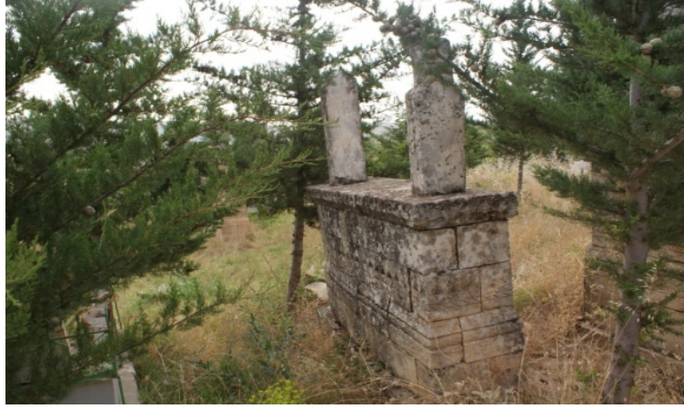
Şekil 1 : Hacı Altun Mezarından Görünüm

Mezar taşı sandukalı olarak ele alınmış olup, üzerine aziziye 4 tipi başlıklı ayak ve baş taşları yerleştirilmiştir (Şekil 1).