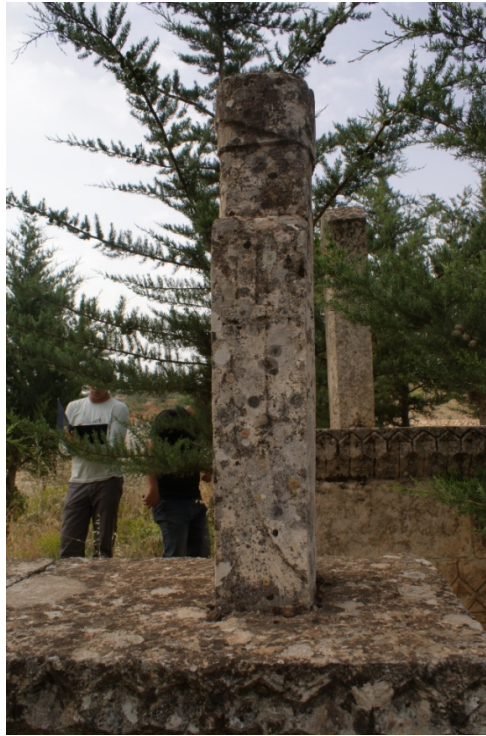
Şekil 5 : Hacı Altun Mezarı Kılıç Motifi

Mezarın baş şahidesi batı tarafta olup, ön yüzü doğuya bakmaktadır. Şahidenin ön yüzünde, küçük bir dikdörtgen içerisine alçak kabartma tekniğiyle işlenmiş Osmanlıca tarih kitabesi görülmektedir. Baş şahide, yan yüzlerindeki unsurlar ile de önem taşımaktadır. Taşın kuzeye bakan yan yüzünde, yüksek kabartma tekniğinde kavisli ve keskin hatlarla işlenmiş kılıç motifi dikkat çekmektedir (Şekil 5). Güney yüzde ise, yukarıdan sarkıtılan bir kolye ucuna bağlanmış üçgen şekilli muska ve muska kabı bulunmaktadır (Şekil 6). Yüksek kabartma tekniğindeki kare şekilli muska kabının altı, dört adet diş sırası ile hareketlendirilmiş ve püskül görünümü verilmiştir. Baş şahide, aziziye tipi bir fes ile sonlanmaktadır. Ayak şahidesi sade olup, üstte üçgen bir form ile biçimlendirilmiştir.