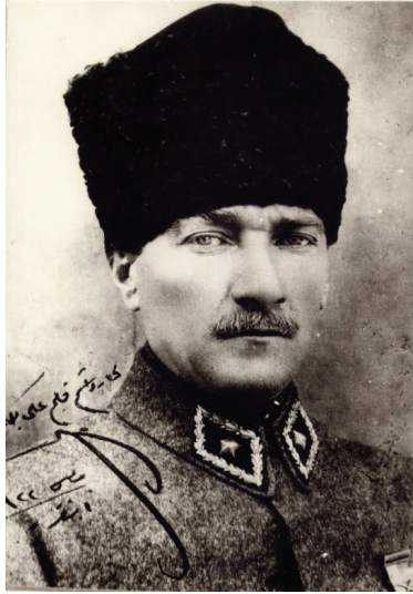
Ek 2: Mareşal Gazi Mustafa Kemal ATATÜRK (Selanikli)