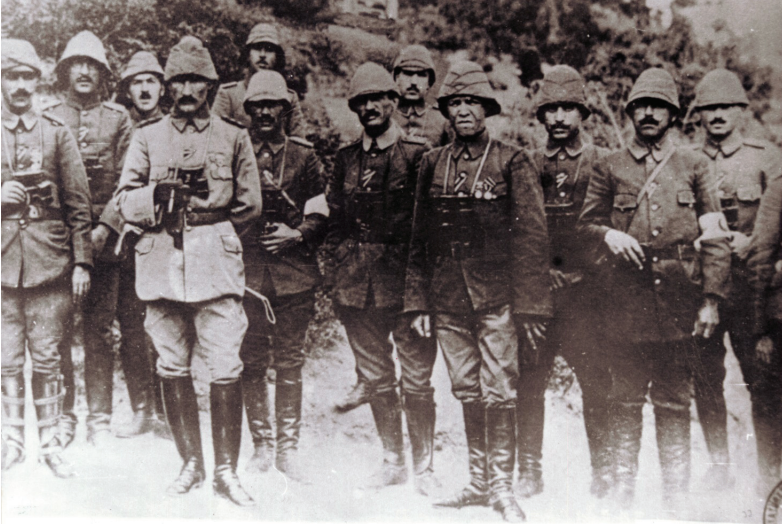
Ek 1: Anafartalar Grup Komutanı Kurmay Albay Mustafa Kemal ve Arkadaşları