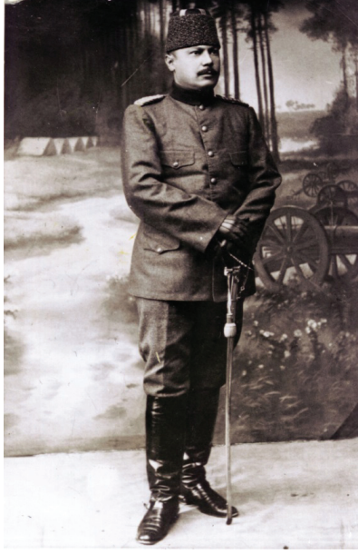
Ek 4: Şehit Binbaşı Hüseyin Avni Arıburun (Manastırlı)