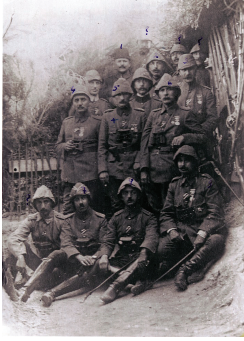
Ek 6: 3. Kolordu Komutanı Esat Paşa–19.Tümen K. Kur. Alb. Mustafa Kemal ve Diğer Subaylar Çanakkale-1915