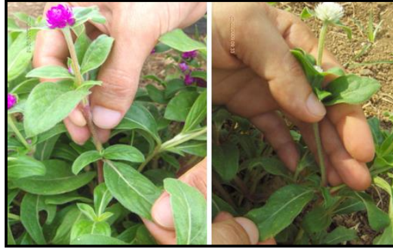
Şekil 2. Araştırmada kullanılan Gomphrena globosa 'da yaprak örneklemesinin yapılışı.