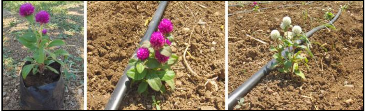
Şekil 1. Araştırmada kullanılan Medine çiçeği ( Gomphrena globosa ) fidesi ve toprağa aktarıldıktan sonraki görünümü.