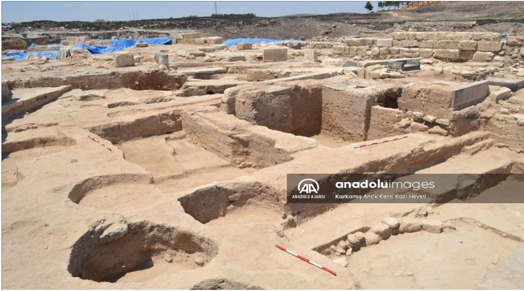
Görsel 2: Karkamış Antik Kenti, Gaziantep

Türkiye-Suriye sınır hattında bulunan ve Anadolu ve Mezopotamya bölgesinde yüzyıllarca hüküm süren Hititlerin en önemli yönetim merkezi Karkamış'taki bu gerçekler, kadının toplumun merkezinde yer aldığına önemli bir kanıttır.