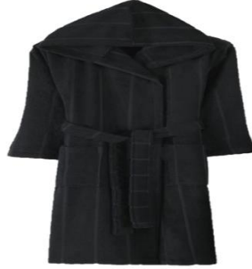
Şekil 7: Temsilî Bornos

Kaynak: Aslı için bkz. İbn Abdissettâr, Libâsu'r-Resûl ve's-Sahâbe ve's-Sahâbiyyât , 184.