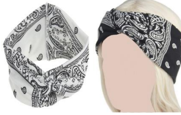
Şekil 3: Temsilî Asâbe

Kadınların başörtüsü olarak kullandığı inanç ve kılık kıyafet ilişkisi çerçevesinde ele alınacak bir başka giysi de Himâr dır (Ar. حمار). Himâr kadınların baş, göğüs ve sırt bölgelerini örtecek şekilde pamuk, ipek, keten, yün ve kadife gibi farklı kumaşlardan yapılan bir kıyafetti. 59 İslâm'ın ilk dönemlerinden itibaren giyilen 60 humâr , Abbâsîler döneminde de giymeye devam etti. Mir'âtü'l-Cenân 'da Hârûnürreşîd dönemindeki bir kadının giydiği humâr dan bahsedilmektedir. 61