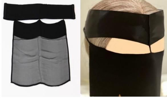
Şekil 5: Temsilî Burku‘

Kaynaklarda burku‘a benzeyen ve bazen onun yerine kullanılan Nikâb , (Ar. النقاب) adında bir kıyafetten daha bahsedilmektedir. Nikâb kadınlar tarafından yüzü kapatmak için kullanılan bir çeşit peçeydi. Tıpkı burku‘da olduğu gibi nikâbda da kadınların görebilmesi için iki delik bulunmaktaydı. 71 Câhiz‘de geçen bir rivayette, düğüne giden kadınların yüzlerinde nikâb olduğu kaydedilmektedir. 72 Bir diğer baş kıyafeti de yine peçe gibi kullanılan lisâm dır (Ar. اللثام). Lisâm, burundan itibaren yüzün alt kısmını kapatan bir kıyafettir. 73 Abbâsîlerde lisâmı kadınların 74 yanı sıra bazen erkeler de kullanıyordu. Mansûr‘un yanına gelen bir adam, yüzünü bu kıyafetle kapatmıştı. 75 Lisâm her zaman kullanılmaz, genellikle çölde yaşayan Araplar tarafından tercih edilirdi. Kadınlar kınâ‘ını, erkekler de imâmesini bazen lisâm olarak kullanırlardı. 76 Mu‘cemlerdeki ifadelerden sonraki dönemlerde kadınların baş bölgesine kullandığı kıyafetler olduğu