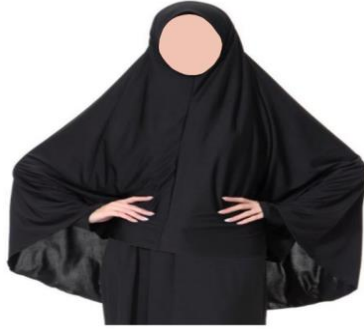
Şekil 4: Himâr

Dönemin diğer bir kıyafeti de Kınâ 'dır (Ar. القناع). Kadınlar oldukça geniş bir kumaştan imâl edilen kınâ 'ı başın yanı sıra yüzlerini kapatmak