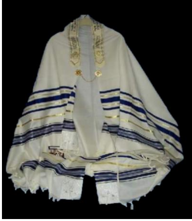
Şekil 6: Temsilî Taylesân 88

Kaynak: Aslı için bkz. İbn Abdissettâr, Libâsu'r-Resûl ve's-Sahâbe ve's-Sahâbiyyât , 185.