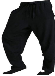
Şekil 9: Sirvâl

Kaynak: İbn Abdissettâr, Libâsu'r-Resûl ve's-Sahâbe ve's-Sahâbiyyât , 186.