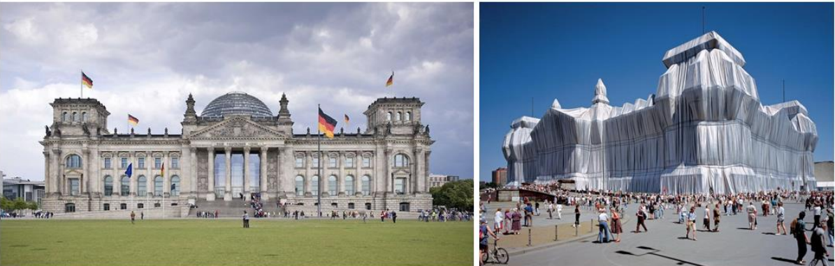
Şekil 5 - Berlin, Christo ve Jeanne Claude tarafından paketlenen Reichstag Binası (sol: URL-4, sağ: URL-5).