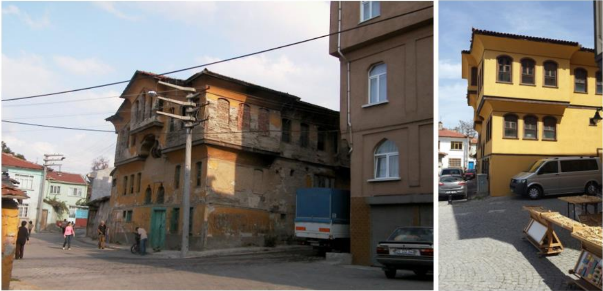
Şekil 6 - Eskişehir, Odunpazarı, Sarı Konak, öncesi (2010) (sol) ve sonrası (2014) (sağ) (Yazarın Kişisel Arşivi).

Bu iki örnekte görüldüğü gibi, özellikle kentle ve insanlarla ilişkisi uzun süreli olan, bellekte yer edinmiş ve kent belleğinin oluşumunda etkisi olan yapılarda herhangi bir değişim ve dönüşüm meydana geldiğinde, yerle kurulan ilişki ve dolayısıyla kent deneyimi dönüşmektedir. Özellikle her gün kullanılan bir köprü veya önünden geçilen bir yapının, soyutlanarak ve tüm detaylarından kopararak kütesel bir varlığa indirgenmesi gibi bir uygulama ile, gündelik algılar, yer bilgisi ve deneyim farklılaşmaktadır. Alışılmış imgenin dışında bir imge üretimi gelişmekte, algı değişmekte ve bir farkındalık elde edilmektedir. Aslında unutmada olmadan hatırlama olamayacağı için, mevcut durum unutturularak hatırlama sağlanmaktadır denilebilir. Burada sanatın ve sanatsal olanın kasıtlı ve bilinçli tercihlerinden söz edilebilir. Bu gibi kasıtlı uygulamaların yanında, kontrol dışında gelişen, zamanın getirdiği bazı algı kaymaları, bellek gelişimi ve yeni deneyimlerden de bahsedilebilir. Bu da kentlerdeki hızlı dönüşüm sonucu olabileceği gibi, kentteki mekân üretiminin, “tüketmek” kavramıyla ortaya konulmasından ileri gelebilir. Turistik hale gelmiş mekânlar bu duruma iyi bir örnek sunabilir (Şekil 6).