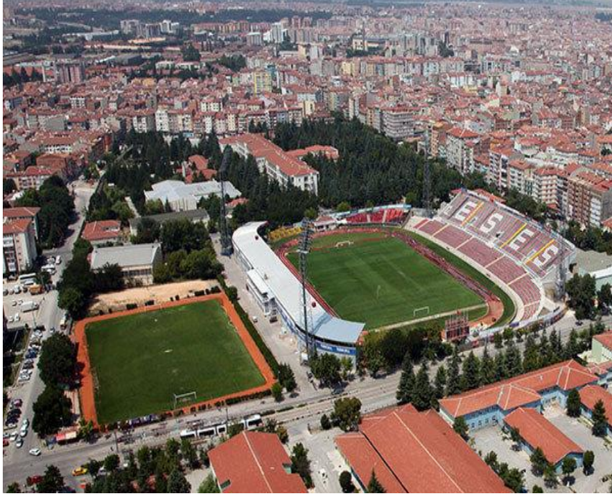
Şekil 7 - Yıkılmadan önce Eskişehir Atatürk Stadı (URL-6).