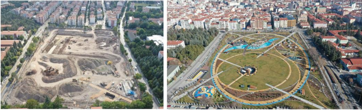
Şekil 8 - Yıkım sonrası stadyum alanı (sol:URL-7), Millet Bahçesi olduktan sonraki görünüm (sağ:URL-8).

Mekânın bellek ile kurduğu doğrudan ilişkiye karşın modernite, mekân-zaman ve bellek ilişkisini dönüştürmüştür. Zamanın süreksizleşmesi, belleğe ait bileşenler olan mekân ve zaman kavrayışını değiştirmiştir. Zaman, modernitenin mekânında yok olarak, ölçüm aletlerine kaydedilerek işlevsizleşmiş, dolayısıyla imge ve bellek de birbirinden kopmuştur. Öte yandan, aşırı hatırlamanın ( hipermnezî ) yarattığı hatırlama sonrası ( post-mnemonic ) kültür (Connerton, 2009, s. 140), unutma çağını tanımlarken kent mekânını da yeniden organize etmektedir. Toplumsal bağlamda unutmamaya yönelik yapılan müdahaleler, hatırlamanın abartılı dünyasını da sunmaktadır. Geçmişten çağrılan veya yeniden üretilen fragmanlar ve imgeler, kentsel mekânda geçmişten gelen yabancı nesnelere yer almaktadır. Bu nedenle aşırı hatırlama, unutma korkusuyla yapılan, geçmişte kentsel mekânda hiçbir zaman var olmamış mekânsal temsilleri meşru kılmaktadır. Ankara Hacı Bayram bölgesi'nde yapılan müdahaleler, bu duruma örnek gösterilebilir. Bölgenin kentsel mekânında daha önce hiç yer almamış yapıların inşası ile oluşturulan yeni imge, hem alanda mevcut