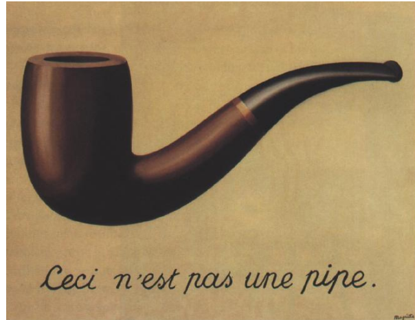
Şekil 1 - René Magritte, İmgelerin İhaneti, 1928-1929 (URL-1).

Görsel ve yazılı temsil araçlarının, temsil ettikleri nesneyi tam olarak ifade edemediğine dikkati çeken ressam René Magritte, “İmgelerin İhaneti” adlı tablosunda, resmettiği piponun altına “Bu bir pipo değildir” yazarak, bu tartışmayı, gösteren ve gösterilen arasında bir arayüz olarak tanımlanabilen resim sanatı aracılığıyla etkili bir biçimde ortaya koyar (Foucault, 2001). Biri resim diğeri ise dil olmak üzere bu iki soyutlama sistemini, kavramların yazılı ve görsel karşılıklarıyla çatıştırarak elde ettiği zeminde, şeylerin gerçekliği ve temsili arasındaki kopukluğa işaret eder (Şekil 1). Peki, bir başka temsil alanını tanımlayan mimarlıkta, gösteren ve gösterilen açısından bir arayüz var mıdır? Varsa bu arayüz mekânsal deneyimlerde nasıl karşımıza çıkar?