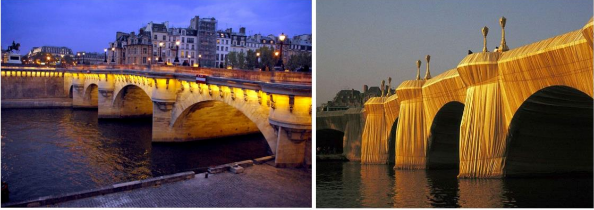
Şekil 4 - Paris, 1985, Christo ve Jeanne Claude tarafından paketlenen Pont Neuf (sol: URL-2, sağ: URL-3)

Mimarlığın, hem yapı hem de kent ölçeğindeki iletişim şeklindeki sürekli dönüşüm, bireylerin deneyimlerini ve buna bağlı olarak bellek oluşumlarını değiştirmektedir. Kent alanındaki sanatsal çalışmalar bu durumun fark edilmesinde veya görünür hale gelmesinde etkili araçlara dönüşebilir. Burada Christo ve Jeanne Claude'nin kamusal alandaki bilindik yapıları kumaşlarla paketleyerek onları olduğundan farklı bir algıya taşımaları örnek olarak gösterilebilir. Sanatçıların bunu yaparken açık bir neden-sonuç ilişkisini planlayıp planlamadıkları tartışılır olsa da bu türden çalışmaların kent mekânındaki algıyı yeniden ürettiği, kent deneyimini dönüştürdüğü ve sorgulattığı çıkarımı yapılabilir. Belleğin ve deneyimin oluşmasının olağan akışına anlık veya belirli bir süre zarfındaki müdahaleler, kenti ve yapıyı sürekli veya bir süreliğine deneyimleyenler açısından oldukça çeşitli bir deneyim ve algı zemini ortaya koyar. Tek bir yapının imgesel versiyonlarının mevcut halinden başka bir durum ortaya koyabilmesi, anlık bir kayboluşla, gerek toplumsal/kolektif ölçekte, gerekse bireysel ölçekte, yer duygusunun altını çizerek yeniden bir hatırlama sağlayabilir. Bu tartışmayı somutlaştırmak için, Christo ve Jeanne Claude'nin 1985 yılında Paris'te paketlediği Pont Neuf ve paketlenmesi 1995 yılında tamamlanan Berlin Reichstag binası iyi örnekler olarak sunulabilir. (Şekil 4).