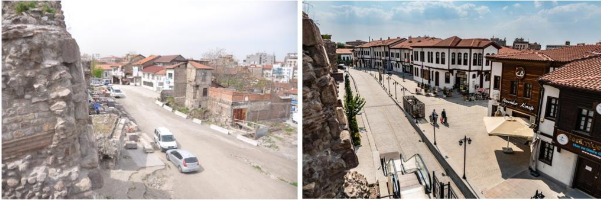
Şekil 9 - Ankara Hacı Bayram Bölgesi ve Yakın Çevresi.

Hem kentlinin gündelik hayat deneyimi hem de turistin ziyaret deneyiminin bir parçası olan fotoğraf ise mekân ve zaman temsiliinin bir aracı olarak görülebilir. Seçme, yorumlama ve sunma süreçleriyle beraber daha önce de bahsedildiği gibi gerçeğin bir parçasının temsilini oluşturmaktadır. Bütüne dair fikir vermekten çok gösterilenin anlık durumunu yansıtmaktadır. Turist deneyiminde mekânsal bir kesitin anlık görüntüsüdür. Bu nedenle en iyi ve en yeni donmuş görüntüyü temsil etmesi sürekli talep edilmektedir. Hacı Bayram Bölgesi'ndeki durum da yeniden üretilen kimliğin ve imgenin temsiliinin aracı olarak görülebilir (Şekil 9).