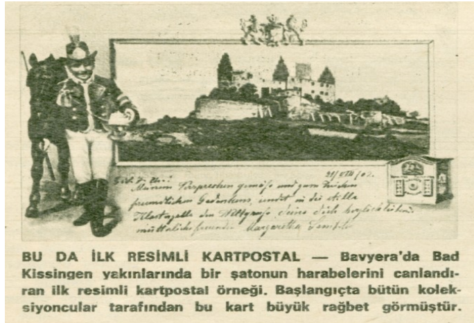
Şekil 4: İlk Resimli Kartpostal

1891 yılında ilk kez “Cartes Postales Illustrées” yani resimli kartpostallar piyasaya çıktı. (Sungur, 2011: 830-831) Bu kartpostalların ön yüzü tamamen fotoğraflardan oluşuyordu. Resimli haliyle tüm Avrupa ülkelerinde kullanılmaya başlayan kartpostal sadece haberleşme aracı olmanın yanında fotoğraf makinesi olmayanlar için turistler ve koleksiyoncular için yeni bir ilgi alanı açmıştır.