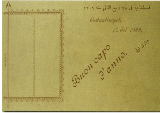
Şekil 6: Ebuzziya Tevfik – 28 Rebiülsani 1306 (1889) – Mübarek Ola