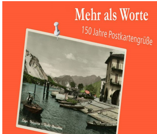
Şekil 12: Sergi Davetiyesi: Berlin İletişim Müzesi’nde “Kelimelerden Daha Fazlası – 150 Yıllık Kartpostal Selamları” sergisi.

Son yıllarda Dünyada kartpostallar üzerine farkındalığın arttığı, araştırmaların ve sergilerin yapıldığı çalışmalar görülmektedir. Örneğin; Museum für Kommunikation Berlin (Berlin İletişim Müzesi)’nde, 21 Ağustos 2019 – 2 Şubat 2020 tarihleri arasında Kartpostalın 150. yılını kutlayan “Kelimelerden Daha Fazlası – 150 Yıllık Kartpostal Selamları” isimli bir sergisi düzenlendi.