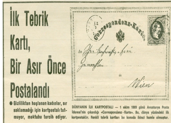
Şekil 3: Hayat: Haftalık Mecmua, sayı 49, cilt 3: 1970

1 Ekim 1869 yılında Avusturya’da yaşanan olayın hikâyesini anlatarak kartpostalın doğuşunu okuyalım: “1869 yılının soğuk bir sonbahar günü Avusturya’nın başşehri Viyana’da gazetelerini açanlar, orijinal fikirleriyle şöhret yapan genç üniversite profesörü Emmanuel Herrmann’ın yeni bir teklifi ile karşılaştılar. 29 yaşındaki bilim adamı bu defa insanların önemli bir dertlerine çare buluyor ve onları uzun ve can sıkıcı mektuplardan kurtarıyordu... Hele birkaç cümleyle ifade edilen tebrikler için bundan uygun yol olamazdı. Fikir, enteresandı. Prof. Herrmann, üst köşede pulu ile beraber basılmış küçük dört köşe bir kart düşünmüştü. Üstelik bu kartların posta ücreti daha ucuz olacaktı.