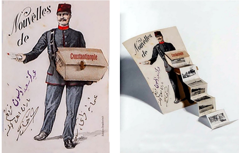
Şekil 1-2: Bayram tebrik kartı - İyediniz Said Olsun Kardeşim (Bayramınız mübarek olsun) notuyla postalanmış

Ferguson 2006 yılında yazmış olduğu makalede tarihçilerin ve sosyal araştırmacıların neden geleneksel olarak resimli kartpostalları meşru bir araştırma konusu olarak görmeye isteksiz olduklarını anlamaya çalışmıştır. Makalede, kartpostalın 19. ve 20. yüzyıllardaki gelişimi bağlamında karşılaştığı zorlukları ana hatlarıyla şu şekilde açıklamıştır. “Akademisyenlerin araştırmalarında kartpostal kullanımına ilişkin kendi yorumlarını gözden geçirmek, kartpostalın rekor olarak değişen değerine dair ipuçları sağlar. Artık akademik dipnota geçmeye ve araştırmacılar için değerli bir belgesel formu olarak yeniden ortaya çıkmaya başlıyor” (Ferguson, 2006: 1). Bu bağlamda kartpostallar insanın geçmişten günümüze aktardığı ortak kültürel birikimin taşıyıcısı olan dilsel ve göstergebilimsel anlamda değeri olan bilgi kaynaklarından biridir (Östman, 2004: 424).