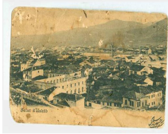
Şekil 11: 1890 Üsküp- Nadir Kartpostal, Editör: J. Saadi

Bu kartlarda şiir, estetik ve sanat sanki dile gelmiş konuşuyor. Birer kitap, hatta bazen birer kütüphane, bu kartpostalların her biri. İçlerine dalar giderseniz, bir güzel düş kadar tatlı.” Boyacıoğlu’nun diğer koleksiyonları arasında eski senetler, diplomalar, tahviller, tebrik kartları ve sigara kâğıtlarının kapakları da bulunmaktadır (Gülersoy, 1969: 16-17).