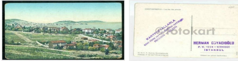
Şekil 9-10: 1923 Büyükkada Herman Boyacıoğlu Damgalı Roçat Kartı. 1970-71’deki sergi damgasını da içeriyor.

“1962 yılında başlamış kartpostal koleksiyonuna. Önce kendi deyimiyle «kedi-medi» resimleri toplarken, merak kendisini sarmış. 7 yılda 100 bin kartpostal sahibi olduğunu öğrendiğim ve gidip gördüğüm zaman ben de epeyce hayrete düştüm. Kendisi mütevazı ve sakin bir vatandaşımız. Bir ara ünlü bir tarihçimizi ziyaret edip yaptıkları hakkında bilgi vermek istemiş. Ancak hiç ilgi ve iltifat görmemiş. Sonra onun bir yakınına koleksiyonundan iki-üç mücevher göstermiş ve bunlar bahse konu âlimimize de gitmiş. İşte o zaman, bu şöhretimizin, benim koleksiyon karşısında duyduğum hayret ve haset duygularımdan çok daha fazla bir telâş ve nedamete kapıldığını öğrendim de, benim ateşim hafiflemiş oldu.