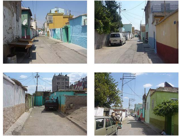
Şekil 6. Çalışma Alanına İlişkin Fotoğraflar

Mevcut imar planlarında öngörülen 7 metrelik yaya yolları ve en az 1.5 metre kaldırımlı taşıt yollarına rağmen, mahallede sokaklar genellikle dar ve kaldırımsız ya da bir metre kaldırımlıdır. Otopark alanı bulunmamaktadır. Arabalar, üç tekerlekli motosikletler sokak üzerine ya da boş arsa üzerine park etmektedir (Şekil 6). Çocuk oyun alanı için ayrılmış bir alan bulunmadığı için çocuklar sokaklarda oynamaktadır. Sokaklarda seyyar satıcılar, çöpler, kâğıt ve hurda yığınları görülmektedir. Ulaşım bağlantıları incelendiğinde; alan içerisinde düzenli bir ulaşım ağı bulunmamakta olup, organik bir yapı gözlenmektedir. Yol genişlikleri aks boyunca değişkenlik göstermekte olup, bazı yollar çıkmaz sokakla sonlanmaktadır.