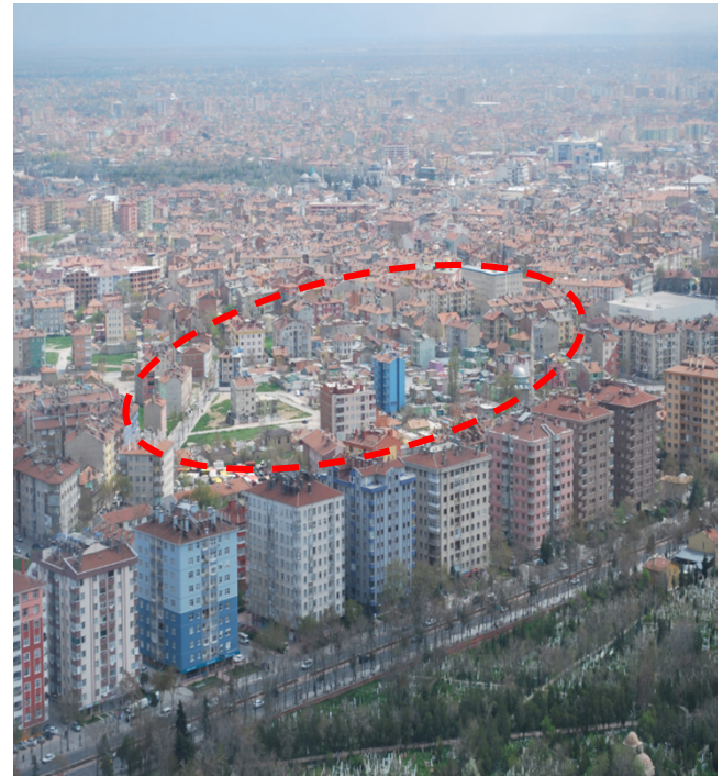
Şekil 3. Çalışma Alanı ve Yakın Çevresinden Görünüm

Konya-Ankara ulaşımını sağlayan Ankara Caddesi'nin doğusunda bulunan on katlı yapılar, Doğanlar mahallesini kentten ayırmakta ve harabe görüntüsünü engellemektedir (Şekil 3).