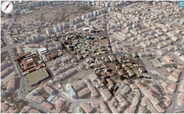
Şekil 5. Çalışma Alanının Üç Boyutlu Görüntüsü

Çalışma alanı sınırları içerisinde 15 adet yapı adası bulunmaktadır. Yürürlükteki imar planlarında, çalışma alanına ilişkin, konut fonksiyonu ağırlıklı mevcut yapıyı temel alan planlama kararının getirildiği ve mevcut duruma göre yapı adalarının sadece %10'unun plan şartlarına göre oluştuğu saptanmıştır. Yapıların taban alanı ve adaların büyüklükleri arasındaki ilişki incelendiğinde, ortalama her yapı adasının % 42'si yapılaşmamıştır. Çalışma alanının kuzeyinde bulunan henüz yapılaşmamış 2 yapı adası hariç, genellikle yoğun bir yerleşme deseni söz konusudur. Bu yoğun yerleşme, alanın kuzey batısı ve güneyinde % 52 oranına kadar yükselmekte, kuzey doğusunda %10 oranına kadar azalmaktadır. Organik bir yapı ve büyük yapı adalarının olması yapılaşma oranını azaltmaktadır (Şekil 5).