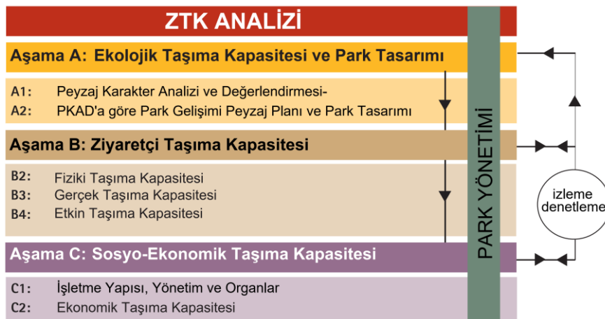
Şekil 3. Ziyaretçi taşıma kapasitesi (ZTK) analizi

Bu çalışma ile önerilen ZTK analizi, sistematik olarak yapılmış üç aşamadan oluşmaktadır (Şekil 3): (A) Ekolojik taşıma kapasitesi (B) Ziyaretçi taşıma kapasitesi ve (C) Ekonomik taşıma kapasitesi. Bir parkin tasarımında ve uygulama sonrası yönetiminde, bu üç aşama birbirini etkileyen, bu nedenle geribeslemeli ve bütünleşik aşamalar olarak ele alınmalıdır.