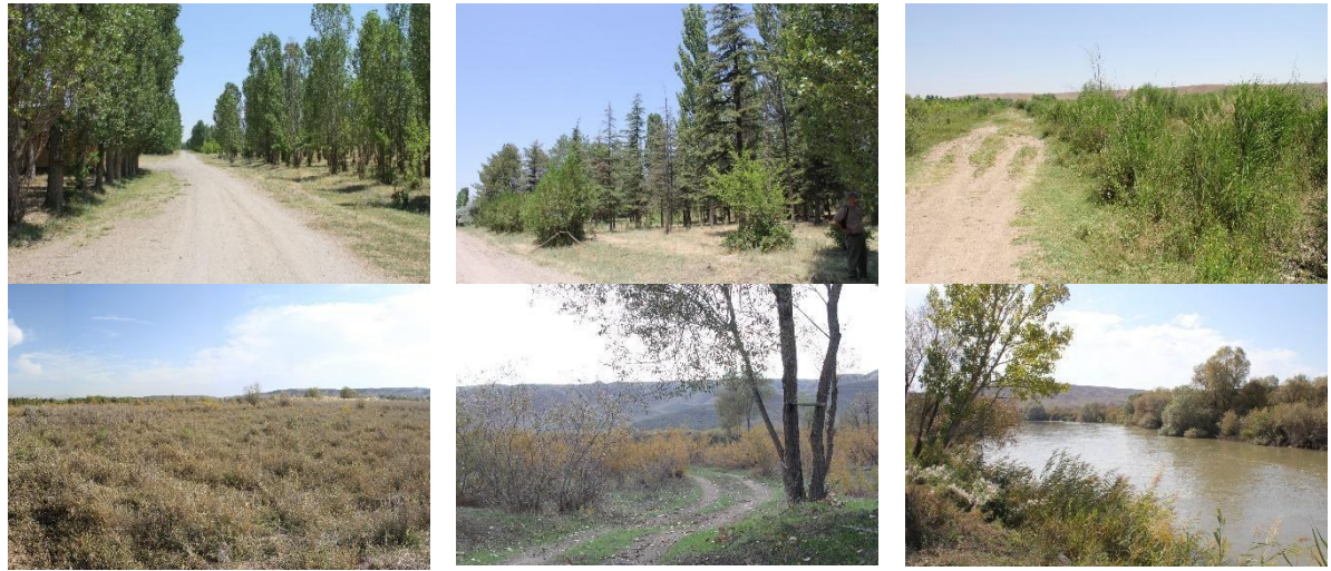
Şekil 2. Çalışma alanı peyzajı

Bu çalışma ile önerilen ZTK analizi, sistematik olarak yapılmış üç aşamadan oluşmaktadır (Şekil 3): (A) Ekolojik taşıma kapasitesi (B) Ziyaretçi taşıma kapasitesi ve (C) Ekonomik taşıma kapasitesi. Bir parkin tasarımında ve uygulama sonrası yönetiminde, bu üç aşama birbirini etkileyen, bu nedenle geribeslemeli ve bütünleşik aşamalar olarak ele alınmalıdır.