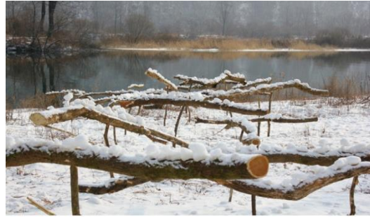
Görsel 14: Lee, Kuei-chih, "Kar Nabzı" 2013, Kore