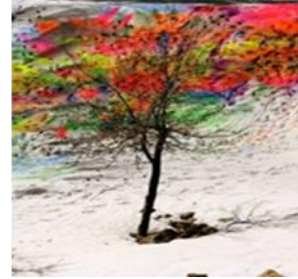
Görsel 25: Yücel Dönmez Antalya Akseki, 2015