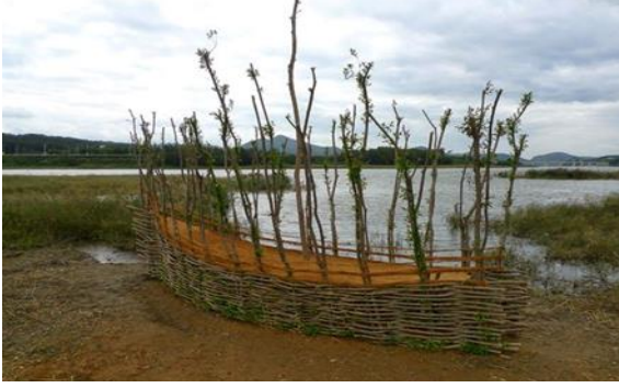
Görsel 7: Lindenbauer Alois, Growing Boat 2012

YATOO üyesi sanatçılar, doğayla diyaloglarını, doğayla bir olmak üzerine kurgulayıp, doğa sanatı uygulamalarında doğal çevreyi ve sunduklarını kullanarak, yapısına müdahalede bulunarak sanatsal üretim yapmaktadırlar. Alois Leopold Lindenbauer (Görsel 7-8) sepet şeklinde örülerek tekne formu verilmiş bir yapıyı yerel toprakla doldurmuş ve canlı söğüt ağaçları dikmiştir. Zaman içinde büyüyen söğüt ağaçları tam bir tekne formunu almıştır.