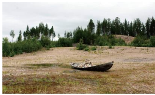
Görsel 12: Karen "Waiting for the Tide", 2013