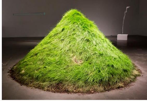
Görsel 6: Hans Haake, Grass Grows 1968

Doğa sanatında yapının tasarım sürecinde sanatçıyı yönlendiren ve bulunduğu ortamla nasıl bir etkileşim kuracağını belirleyen doğanın kendisidir ve sanatçı ilhamını, tamamen doğadan ve bulunduğu arazinin sunduklarından alır.