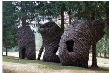
Görsel 16: Patrick Dougherty, Tana Libera Tutti, Arte Sella, 2011, İtalya