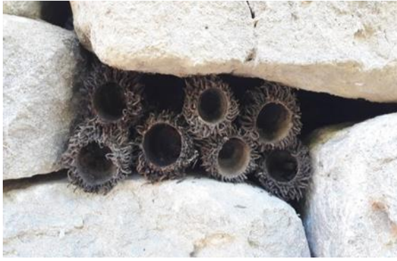
Görsel 30: Sema Okan Topaç 2018 Bulgaristan

ile düşünen, bütünleşen, tasarlayan, doğaya sanatla bakan ve doğadaki yaratı süreciyle mutlu olan bir gruptur” (Bingöl, 2017). Yaşadığı deneyimleri paylaşmayı, ulusal ve uluslararası etkinlikler oluşturmayı önemsemektedir Grup kurulduğundan beri Ulusal ve Uluslararası proje ve sergiler gerçekleştirmiştir. Bunlardan bazıları 2017 yılında 4. Uluslararası İzmir Güncel Sanat Trienali kapsamında GNAP Türkiye-"Doğanın İzinde" projesi hayata geçirilmiştir. Eş zamanlı olarak İzmir ve Nevşehir Kapadokya’da yapılan doğa çalıştaylarında ortaya çıkan çalışmalar 36 ulusal ve uluslararası sanatçının katılımıyla Doğa sanatı sergisi ile sonuçlandırılmıştır. 2018 yılında Bulgaristan Veliko Tarnovo şehrine bağlı Gabrovtsi köyünde Patika Sanat Grubu ve Duppini Art Group işbirliğinde Uluslararası Çevresel Heykel & Doğa Sanatı Sempozyumu gerçekleştirilmiştir. 2019 yılında Bulgaristan’ın Filibe A.B. Kültür başkenti projesi kapsamında ‘Meriç Nehri’ – Bir nehir üç ülke adlı arazi sanatı etkinliğine Patika Sanat grubu üyeleri olarak katılmışlardır (Görsel 30, 31).