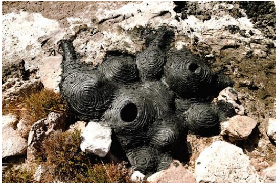
Görsel 9: Onur Fındık GNAP Turkey, İzmir, 2017

Global Nomadic Art Project (GNAP), farklı ülkelerden doğa sanatçılarının farklı coğrafyalarda toplanarak o yer’de ve o an’da, doğanın, coğrafyanın, kültürün ve tarihin özelliklerinden ilham alarak doğal malzemelerle, doğaya armağan ettikleri sanat eserleriyle, tıpkı nomadlar (göçebeler) gibi iz bırakmadan yoluna devam ettikleri bir projedir. YATOO (Kore Doğa Sanatçıları Derneği) tarafından geliştirilen tüm dünyada doğa sanatı alanında çalışan sanatçılar ve küratörleri buluşturan bir projedir. İlk defa 2014 yılında Güney Kore’de başlatılan bu projenin ve 2020 yılında sonlanması planlanmaktadır. 2015’te Kore ve Hindistan, 2016’da Güney Afrika ve İran’da, 2017 yılında İnciraltı, Bahçelerarası, Bergama, Bornova, Kemalpaşa, Seferihisar, Tire ve Kapadokya’ yı kapsayan Bulgaristan, Romanya, Macaristan, Almanya, Fransa ve Litvanya Avrupa kıtasında gerçekleştirildi (Resim 9,10). 2018’de İngiltere sonraki yıl Almanya 2020’de ise Mongolya’da düzenlendi.