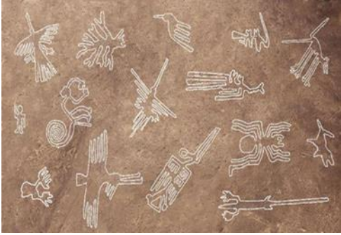
Görsel 1:

Peru'nun başkenti Lima'nın 400 km güneyindeki Andean çölünde bulunan yaklaşık 2000 yıllık Nazca çizimleri, devasa boyutlarıyla (çölün koyu renk üst tabakasının kazılarak alttaki açık renk tabakanın ortaya çıkarılmasıyla oluşturulmuş jeoglifler) insan eliyle yapılmış doğa sanatına örnek olarak gösterilebilir. 800'den fazla düz çizgi, 300 geometrik figür ve arı kuşu, maymun, örümcek gibi 70 hayvan ve bitki tasarımı vardır (Görsel 1 ve 2). 1994 yılında UNESCO Dünya Mirası Listesi olarak belirlenen jeoglifler, 80 yıldan fazla süredir incelenmelerine rağmen, araştırmacılar için hala bir gizemdir 1 .