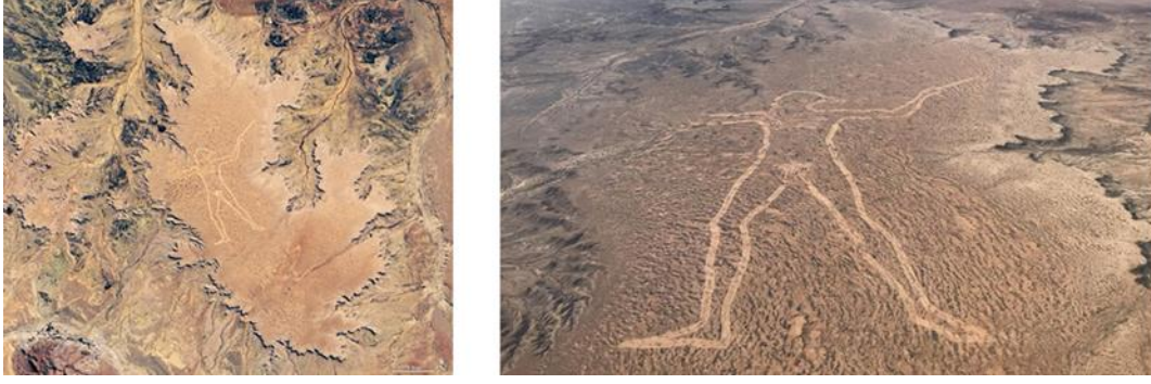
Görsel 3: Phil Turner “Marree Man” Güney Avustralya Finnis Spring Platosu

Arazi Sanatı, Çevre Sanatı ve Doğa Sanatı birbirinden kesin olarak ayrılmadığından, tam bir sınırlama yapılamaz olsa da genellikle birbirinin yerine kullanılan veya karıştırılan sanat kavramları olarak ortaya çıkar. Oldukça karmaşık ve iç içe olan bu tanımlar, malzeme farklılıklarına göre incelenebilir. Land Art sanatı resim, heykel, mimari gibi sanatın diğer disiplinleri arasındaki sınırları ortadan kaldırmıştır. Aynı zamanda kamera veya video ile tespit edilebilen kalıcılığı kayıtlarla tescillenen anıtsal ölçeklere sahip yapıtlar anlamında da kullanılmaktadır.