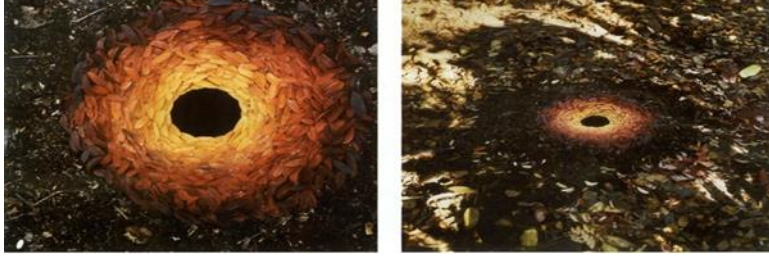
Görsel 4: Andy Goldsworthy “Üvez yaprakları ve delik” 1987

Goldsworthy, sanatını; “Sadece ellerimi ve "bulunmuş" aletleri kullanma özgürlüğünün tadını çıkarıyorum - keskin bir taş, bir kuşun kanat tüyü, dikenler. Her günün sunduğu fırsatları değerlendiriyorum: Kar yağıyorsa karla çalışırım, yaprak düştüğünde yapraklarla olur; devrilmiş bir ağaç, sürgün ve dalların kaynağı olabilir. Keşfedilecek bir şey olduğunu hissettiğim için bir yerde dururum veya bir malzeme alırım. Öğrenebileceğim yer burası” sözleriyle açıklamaktadır (Friedman, 2009: 180-181).