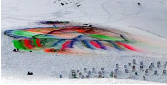
Görsel 24: Yücel Dönmez Antalya Saklıkent Kayak Merkezi, 2013

1975 yılında Uludağ'da ilk kar resmini daha sonra Uludağ'da 1996 senesinde Fuji Film-İstanbul sponsorluğunda 10 bin metre karenin üzerinde bir kar resmi gerçekleştirmiştir. 2013 yılında Antalya Saklıkent kayak merkezinde ve yine Antalya Akseki'de kar üzerine çoklu renk içeren resim çalışmaları yapmıştır (Görsel 24, 25).