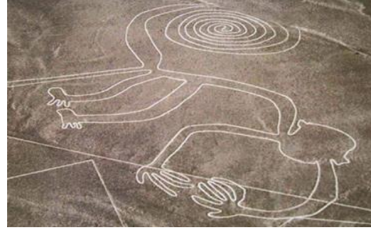
Görsel 2: https://indigodergisi.com/2015/12/nazca-cizgilerinin-sirri/

Güney Nevada'dan Kaliforniya Körfezi'ne kadar Colorado nehri boyunca dağ aslanlarını, kuşları, yılanları ve tanımlanamayan hayvan benzeri figürleri ve geometrik şekilleri tasvir eden 200'den fazla dev figür toprağa oyulmuştur.