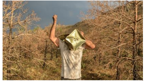
Görsel 22: Mehmet Kavukçu, "Orman Yangını" 2020