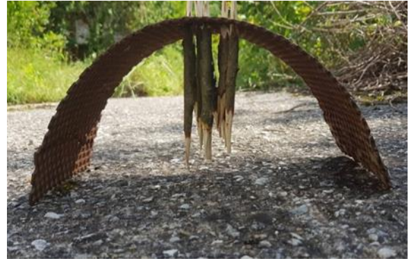
Görsel 31: Varol Topaç 2018 Bulgaristan