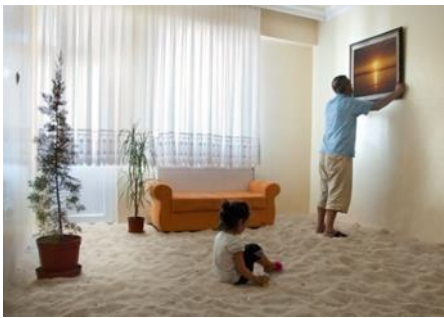
Görsel 26. Cengiz Tekin, "Kum" 2010

Sanatçı, çalışmalarında özellikle yaşadığı coğrafyanın gündemindeki problemlere dikkat çeken video ve fotoğraflar kurgular. Genellikle toplumsal yaşamın gelenek, aile, inanç gibi unsurlarını ele alan sanatçı doğa ve insanı merkeze aldığı işleri ile öne çıkar. “Fotoğraf ve videolarında kusursuz bir kare yerine, tedirgin edici olan görüntülerle izleyiciyi bir başka açıdan görmeye davet eder” Çaylı, E. (2019). Sanatçı Görsel 26’de görülen kum adlı eserinde, gündelik bir mekanda sıradan bir yaz gününü belgelemiştir. Bir kişinin duvara gün batımı resmi astığı ve sakin bir kumsal andıran manzarada bir kız çocuğunun oturduğu görülmektedir. Oda zemini, plaj kumu ile kaplanmış gibi görünse de aslında hızlı kentleşme nedeniyle inşaatlarda kullanılan ve Dicle havzasındaki kum ocaklarından taşınan kum ile doldurulmuştur. Hızlı kentleşme ve artan nüfus yoğunluğu nedeniyle yerkürenin ekolojik dengesinin bozulması konu edinilmiştir.