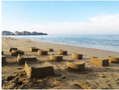
Görsel 29: “İnşa” Bilincin Daire ve Kareleri, Elçin Ekinci, 2013, Kilyos,

Sanatçı, doğal olanın mimari unsurların kalıba sokulması geometrik olarak biçimlendirilmesi, şablonlarla tanımlanması ve sınıflandırılmasını konu edinmekte ve böylece farklı iktidar biçimlerine gönderme yapmaktadır. Sanatçının “İnşa” adlı çalışması, temel geometrik formlar kullanarak temsili yapıların yeniden inşa edilmesi üzerinedir (Hasırcı ve Onan, 2020:93). Söz konusu esere ait bir dizi fotoğraf ve video yerleştirilmesi Düzenin Doğası//The Nature of Order başlığı ile 2013 yılında bir sanat galerisinde sergilenmiştir. (Görsel 29)