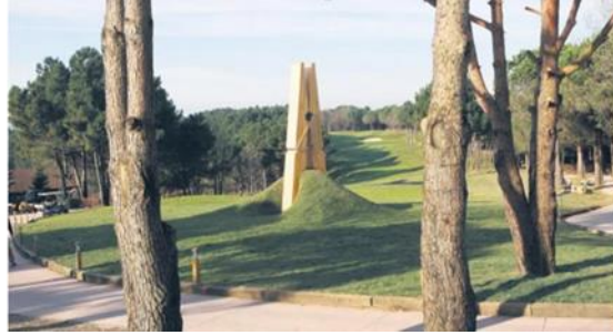
Görsel 17: Mehmet Ali Uysal, "Skin" 2008