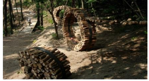
Görsel 27: Varol Topaç Alğı Kapısı Finlandiya 2008