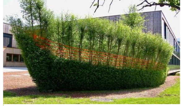
Görsel 8: Lindenbauer Alois, Growing Boat