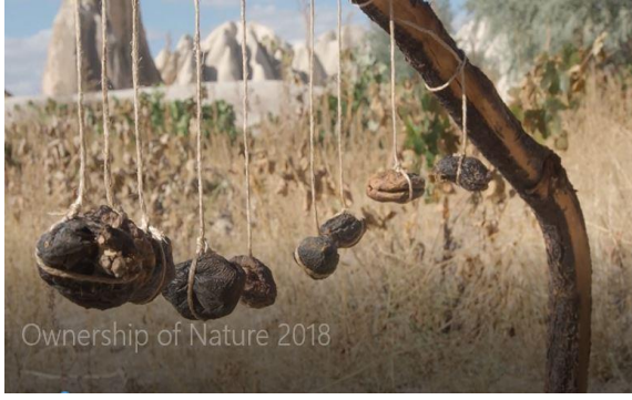
Görsel 32: Ayhan Özer, "Ownership of Nature" 2018