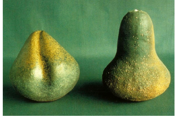
Görsel 3: Eva Kwong, Tuhaf Meyveler (Strange Fruits) , 1983, Stoneware, Odunlu Pişirim, Yüksek 15 cm, ABD.

kültürünün yanı sıra Hinduizm ve Budizm felsefeleri de Hindistan, Nepal ve diğer Uzak Doğu ülkelerinde erotizmin ve cinsel ifade olanaklarının kaynağı olarak ele alınmıştır. Bu durum çağdaş seramik sanatçıların da etkilemiştir. Görsel 3'te Amerikalı sanatçı Eva Kwong'un Tantra kültüründen etkilenerek kadın ve erkek formlarını temsil eden Tuhaf Meyveler (Strange Fruits) adlı eseri yer almaktadır. Sanatçı cinsiyetleri ölüm ve yokluk arasındaki karşılıklı dengeyi ele alarak yorumlamıştır (Mathieu, 2003: 59).