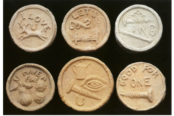
Görsel 4: George E. Ohr, Genelev Jetonları (Brothel Tokens) , 1900, ABD.

20. yüzyılın başlarında Amerikalı sanatçı George Ohr cinsel anlatımlar içeren birçok seramik obje yapmıştır. Ohr'un eserlerinde cinsel metaforlar, kadınsı yaratma ve üreme gücünün etkileri yoğun bir şekilde okunabilmektedir. Sanatçı için her eseri bir doğumu yansıtmaktadır. Bu bakış açısı tüm dünyadaki seramikler, çanak çömlekler ve cinsellik arasındaki bağlantı da bulunmaktadır. Birçok seramik ve çanak çömlek geleneğinde yüzeysel ve biçimsel anlamda gerçekçi ve soyut cinsel çağrışımlı anlatımlara rastlanmaktadır. George Ohr'un Genelev Jetonları (Brothel Tokens) adlı eseri Görsel 4'te yer almaktadır. Sanatçı cinsel birliktelik kavramını mizahi bir şekilde yansıtmaktadır (Mathieu, 2003: 62).