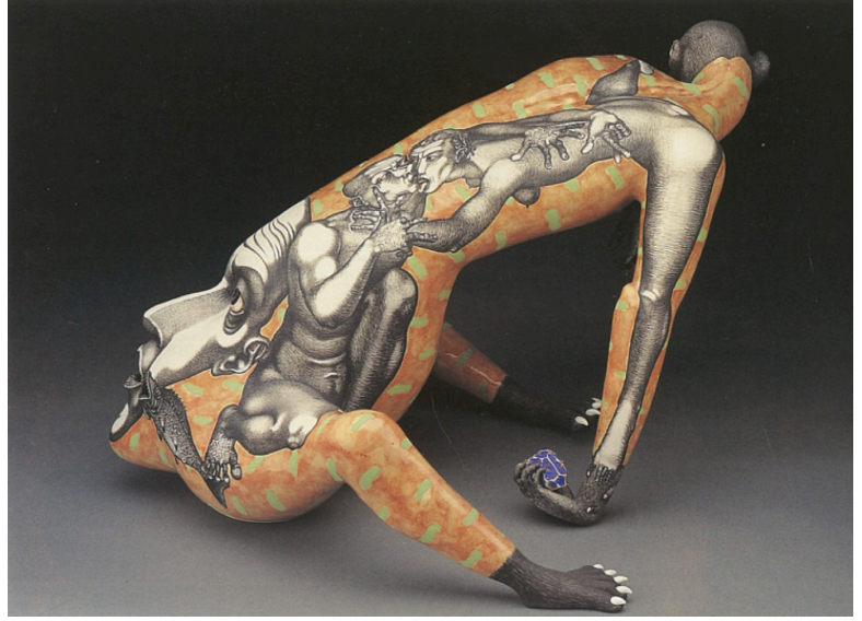
Görsel 5: Sergei Isupov, Korumanın Üstünde (Above Protection) , 1999, 25x40x33 cm, Ferrin Gallery, USA

Above Protection adlı eser kavramsal açıdan farklı anlatımlar da içermektedir. Formun yüzeyinde öpüşür vaziyette yansıtılan kadın ve erkek figürlerinden kadın olanın pozisyonu ve form yüzeyinde yerleştirilişi erkek olan üzerinde bir baskı oluşturmaktadır. Kadın figürünün sol kolu ile erkek figürünün boynunu yakalamışçasına tutuşu ve diğer kolunun kendi sırtına uzanırken eli ile izleyiciye çarpı işareti yapması bu baskının ve bir aldatmanın işaretleri olabilir. Erkek figürün ayakucunda görülen balık, samimi ya da ikiyüzlü fakat cinsel birlikteliğin, üremenin, bereketin baskın olduğu bir duygu yapısının yansıtlıdır. Isupov belki de ana formun yüzeyindeki kahverengi ve yeşil alanlarla cennete, çokgen biçim ile yasak elmaya, yüzeydeki figürlerin pozisyonları ile de şehvet duygusunun sebep olduğu ilk günaha çağrışım yapmaktadır.