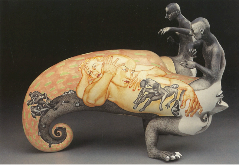
Görsel 6: Sergei Isupov, Zincir (Chain) , 1999, 25x35x20 cm, Ferrin Gallery, USA

Zincir (Chain) adlı eserde heteroseksüel bir çiftin cinsel birliktelik sonrasındaki durumları ya da cinsel birliktelik hakkındaki fantezi dünyaları yansıtılmış olabilir. Eserin merkezinde görülen kadın ve erkek çifti çıplak ve düşüncelidirler. Çevrelerinde sanki buldukları ortamdaki farklı bir yer ve zamanda belki de hayal dünyalarında var olan cinsel birliktelik sahneleri görülmektedir. Ters olarak biçimlendirilen iki kafa ve kafaların çene kısımlarında yükselen figürler, renk bakımından cinsel birliktelik anlatımları ile aynı özellikleri gösteriyor olup, kadın ve erkek, iki kafa ve iki figür formülünü tamamlamaktadır. Bu durum eserin heteroseksüel bir çiftin iç dünyalarını yansıttığı fikrini desteklemektedir. Bu bakış açısının yanı sıra ters kafalardan yükselen figürlerin heteroseksüel çifte yönelen bakışları ve onları kontrol edercesine el hareketleri dikkate alındığında cinsel tatmin ezberinden başka bir değer içermeyen heteroseksüel bir aşk anlatımı da olabilir.