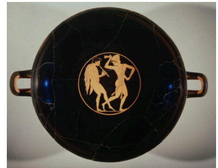
Görsel 1: Erotik sahneli içki kabı (klix), Yunan Arkaik Dönem yaklaşık MÖ 510, kırmızı figürlü seramik, 12,7 x 33,02 cm, The British Museum.

Tarih öncesi çağlardan günümüze bu seramikler buldukları kültürlere ait önemli ipuçları vermektedir. Bu kültürlerden bir tanesi de Antik Yunan Uygarlığıdır. Antik Yunan'ın cinsellik konusunda keskin çizgileri ve tabuları olmadığı ve cinselliği başka toplumlarca ayıp, günah olarak nitelendirilebilecek sınırlarda yaşamadığı günlük kullanım eşyalarının üzerine yaptıkları bezemelerden anlaşılmaktadır. Siyah astarlı, kırmızı figürlü Yunan seramikleri birçok erotik içerikli sahnelerin yanı sıra heteroseksüel ve homoseksüel ilişki betimlemelerinin yer aldığı resimsel anlatımlar içermektedir (Görsel 1). Bu tür sahneler MÖ 6. yüzyılın sonu ve 5. yüzyılın başında en popüler seviyelerine ulaşmıştır ve bu tür yaklaşık 150 sahne vardır. Bu tür imajlar 6. yüzyılın ortalarında siyah figürle sınırlı sayıda başlar ve 5. yüzyılın ortalarında neredeyse hepsi ortadan kalkar (Lynch, 2009: 159).