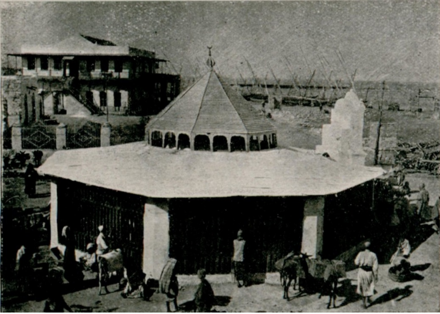
Ek 3. Cidde'deki damıtma makinesinin ahaliye su dađıtımına mahsus mahalli.