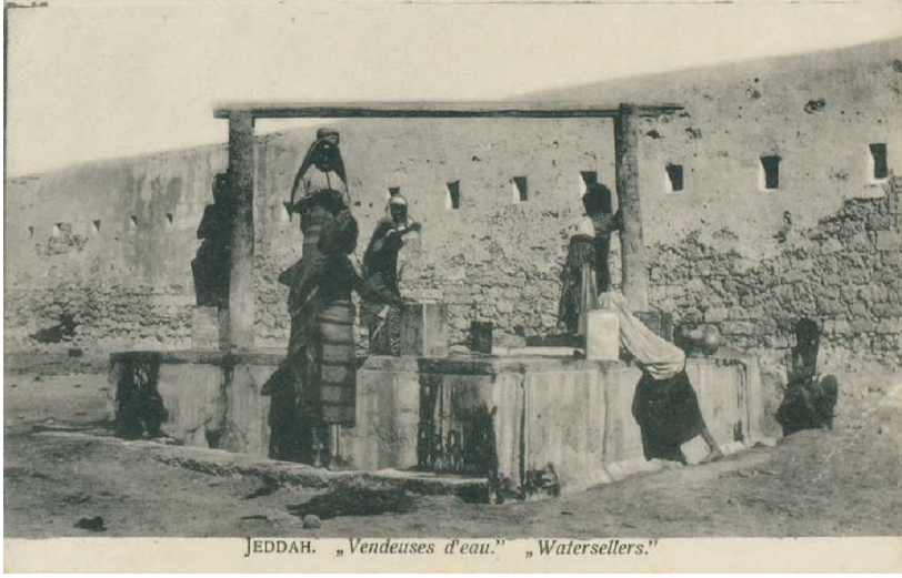
Ek 1. Cidde'de su satıcısı kadınlar. (Kaynak: İ.B.B. Atatürk Kitaplığı, Kartpostal Arşivi No: 27696)