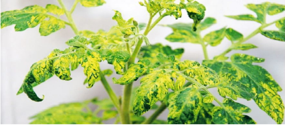
Şekil 2. PepMV'nin domates yapraklarında oluşturduğu parlak sarı lekeler (Hasiow-Jaroszevska ve ark. 2010).