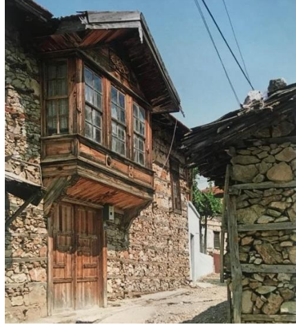
Görsel 5. Taş Kaplı Bir Sokak, Ayazlık Yanında Şahnişir (Günay, 2017: 83,215)

Üretim şekli, yaşam düzeni ve yapıda kullanılan malzemeler geleneksel tasarımı etkileyen etmenlerdir. Ormana Düğmeli evlerin inşasında taş ve ahşap olmak üzere iki malzeme yaygın olarak kullanılmaktadır. Taşların taş ocağından temininden ziyade çevreden toplanılması söz konusudur. Sedir gibi nitelikli ağaçlardan elde edilen ahşap malzeme ise, çürümeye karşı dayanıklıdır. Ahşabı korumak için organik ve kimyasal herhangi bir müdahalenin söz konusu olmaması, malzemenin ekonomik yönünü güçlendirmektedir (Günay, 2017: 286-288).