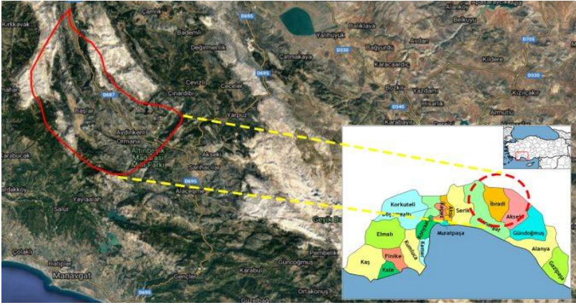
Görsel 3. İbradı İlçesinin Bölgedeki Yeri (URL-2)

Kırsal yerleşim kimliğini koruyan İbradı, Antalya iline bağlı ilçedir. Kuzeyinde Beyşehir ve Seydişehir ilçeleri, güneyinde Manavgat İlçesi, doğusunda Akseki ilçesi, batısında Sütçüler ilçesi yer almaktadır. Son nüfus sayımına göre, İbradı İlçesi'nin nüfusu 2947 olmakla birlikte 9 mahallesi vardır. Ormana mahallesi, bağlı olduğu İbradı ilçesine 15 km, il merkezine ise 286 km uzaklıktadır (URL-1).