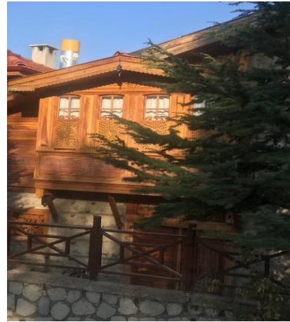
Görsel 6. Yerel Malzeme ve Kırsal Estetik Kesişimden Kesit (Ormana Mahallesi- İbradı, 29. 08.2021)