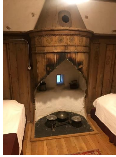
Görsel 1. Kültürel Habitus Örneği (Ormana Mahallesi-İbradı, 29. 08.2021)