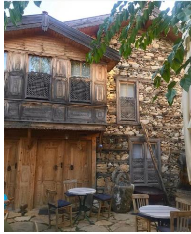
Görsel 2. Kuru Duvar Tekniği ile İnşa Edilen Düğmeli Ev Örneği (Ormana Mahallesi-İbradı, 29. 08.2021)