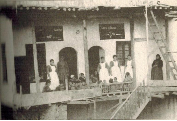
Resim 1: Maraş'taki ilk Alman hastanesi (yılı: 1902)...