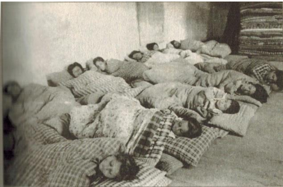
Resim 5: Alman eytamhanesinin yatakhanelisi...