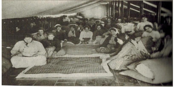
Resim 4: Maraş'taki Alman eytamhanesinde dul kadınlar yatak temizlerken...