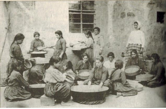
Resim 3: Maraş Alman eytamhanesinde yerel usullere göre kışlık erzağın hazırlanışı...