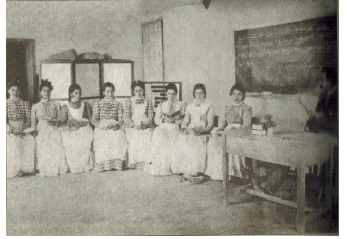
Resim 2: Alman eytamhanesinin dershanesi (Kızlar Mektebi)...