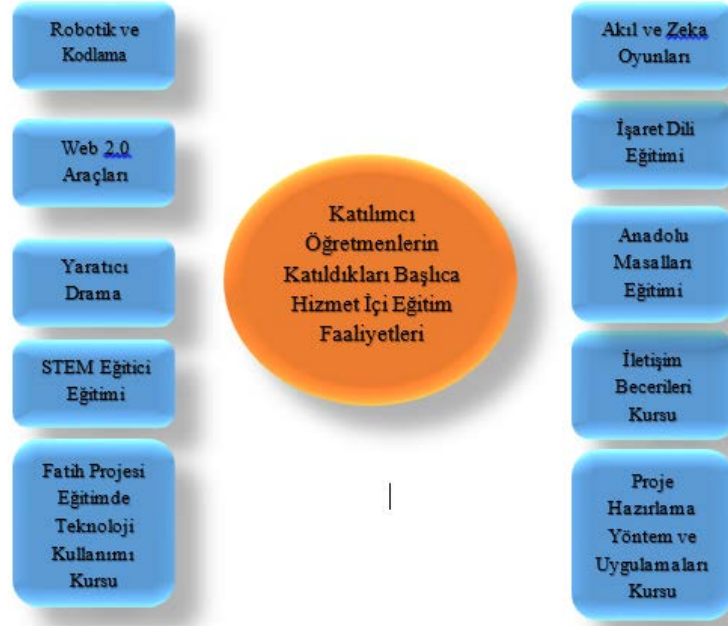
Şekil 1. Katılımcı öğretmenlerin katıldıkları başlıca hizmet içi eğitim faaliyetleri

Şekil 1 incelendiğinde, katılımcı öğretmenlerin başlıca katıldıkları hizmet içi eğitimlerin güncel eğitimler oldukları ve çağımız ihtiyaçlarına hitap eden eğitimler oldukları görülmektedir.