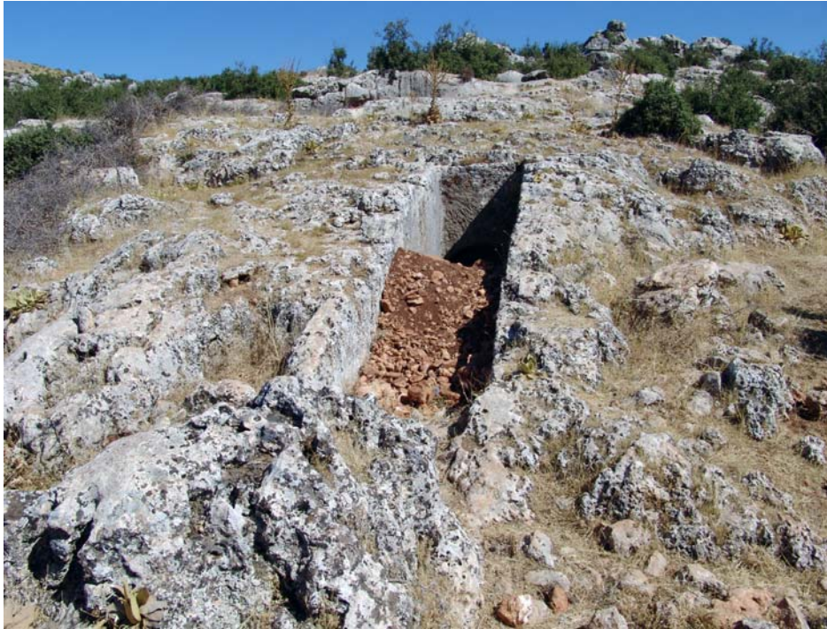
Resim 9. Yapımı tamamlanmamış mezar yapısı, Kuzeybatı Nekropolü

Burada incelediğimiz dromos yardımıyla mezar odası için tercih edilecek yerin önceden belirlendiği, bu tür gömütlerin yapımında ise öncelikle kapıya ulaşan koridorun oyulduğu belgelenmiştir. Ancak mezar sahibinin kendi tercih ettiği bir yerde sipariş üzerine yapım söz konusunu idi, yoksa önceden hazırlanmış bir mezar odası satın mı alınıyordu sorusuna somut yanıt bulunamamıştır.