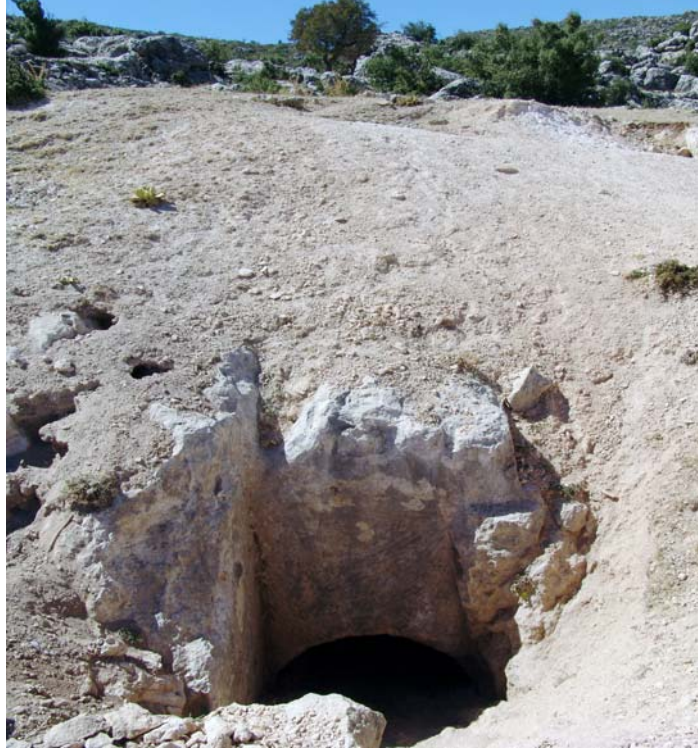
Resim 4. Dromos, GD-Mmezar 1, Güneybatı'dan

Mezar kapısı doğrudan tek odalı bir mezara açılmaktadır (Resim 3). Dromos toprak ve taş ile dolu olduğundan mezar odasına bir insanın zorlukla girebildiği bir açıklıktan ulaşılabilmektedir. Kapı açıklığı mezar odasının iç kısmında dikdörtgen formludur. Söveler ve lento dışı doğru kademeli olarak yükselen üç adet düz silme ile bezenmiştir (Resim 5). Lentonun üzerindeki kalıntılar bu alana kazıma çizgi ile bir madalyon işlendiğini belgelemektedir. Madalyon kıvrımının üst kısmına ait küçük bir kalıntıya dikey aksta bağlanan kazıma çizgi madalyon içerisinde dört kollu bir haçı işaret etmektedir.