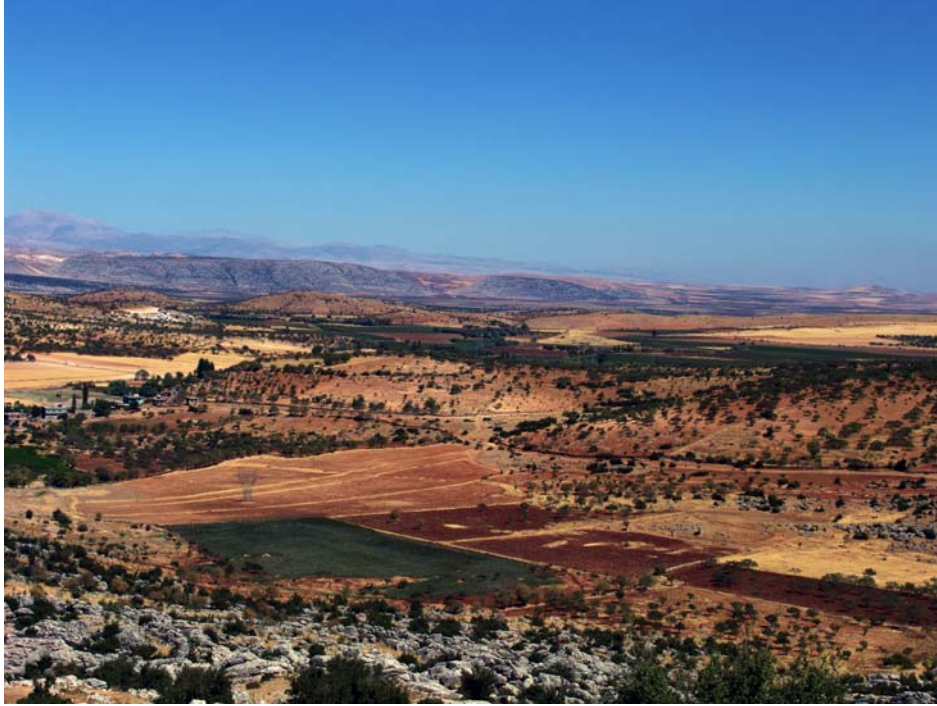
Resim 1. Yukarı Söğütlü, kuzeybatıdan genel

yetersizdir 2 . Köy meydanında ve evlerin duvarları kenarında çevreye dağılmış biçimde duran mimariye ait parçalar – sütun tamburları ve başlıkları– muhtemelen bu yapıya aittir. “Besni Kültür Varlıklarının Tanıtılması ve Ülke Turizmine Kazandırılması” isimli proje, bölgedeki 2005 yılında ilk kez tarafımızdan başlatılan sistemli arkeolojik çalışma niteliği taşımaktadır. Projenin bu alt yapı hazırlık döneminde Yukarı Söğütlü’deki yüzeyde görülebilen antik kalıntılar ve izinsiz sürdürülen kazıların meydana getirdiği tahribatlar dikkatimizi çekmiştir. 2005 yılı çalışmalarımızda elde ettiğimiz bilgi, bulgu ve belgelerin genel değerlendirmesini topladığımız ve arkeoloji bilimi dünyasının ilgisine sunduğumuz kitabımızda Yukarı Söğütlü’ye de konular kapsamında yer verilmiştir 3 .