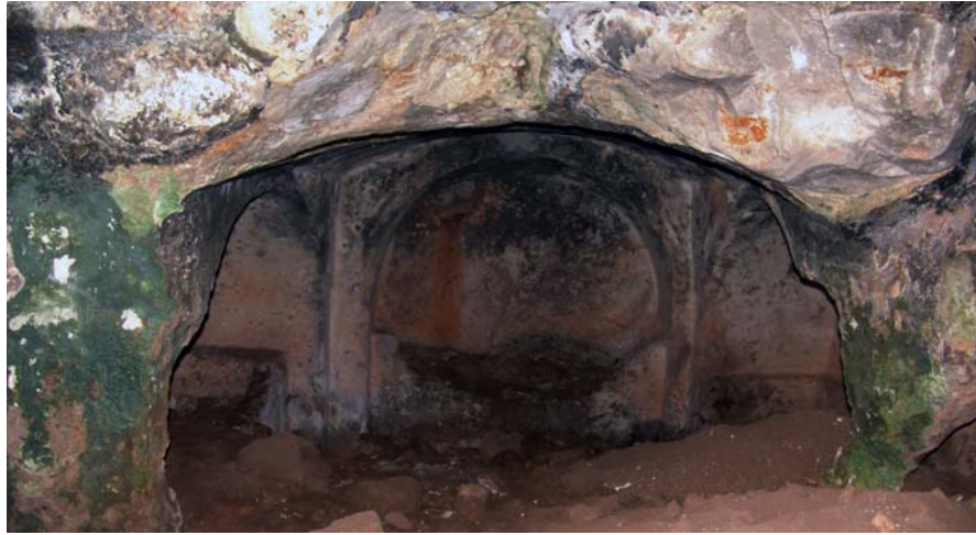
Resim 19. Kabartma Büst, KB-Mezar 1, Kuzeydoğu mezar odası, Güneydoğu, Khamosorion