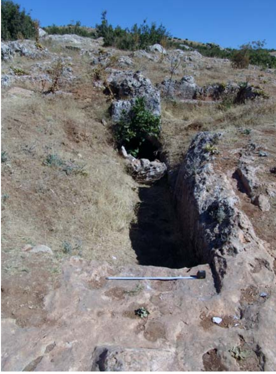
Resim 10. Dromos, KB-Mezar 1, Güneydoğu'dan