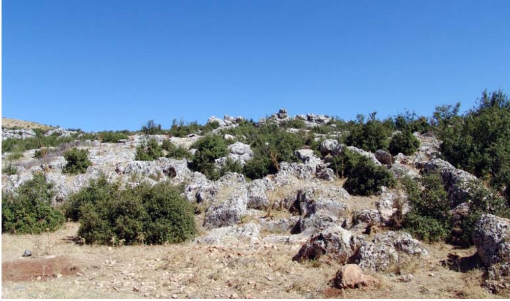
Resim 8. Kuzeybatı Nekropol alanı, Kuzeybatı'dan