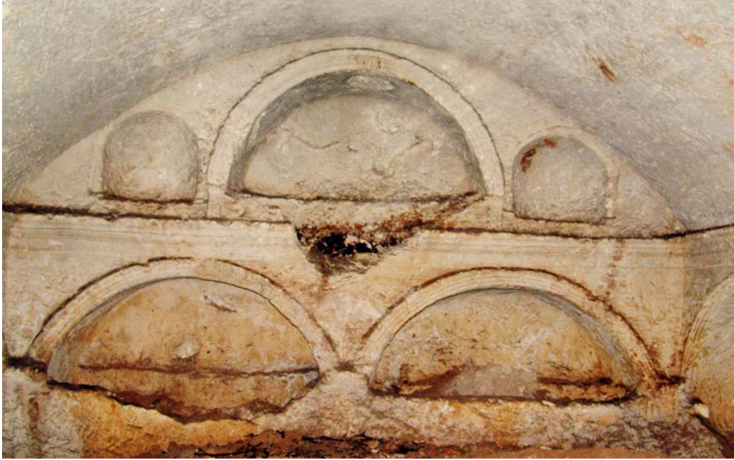
Resim 6. GD-Mezar 1, mezar odasının Kuzeydoğu cephesi

Bu cephede üstte tek, altta ise aynı düzlemde yan yana simetrik biçimde birbirini tekrarlayan formda iki olmak üzere toplam üç adet arcosoliumlu mezar nişi mevcuttur (Resim 6). Nişler ana kayanın içine oyulmuştur. Mezar nişleri tekneli arcosolium tipinin ana unsurlarını taşımaktadır.