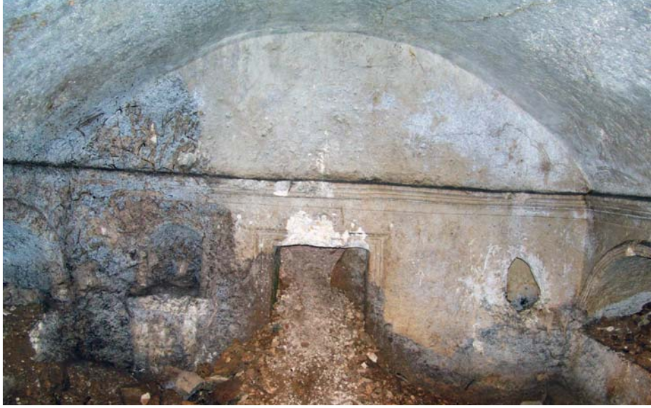
Resim 5. GD-Mezar 1, giriş cephesi (Güneybatı), mezar odasının içinden