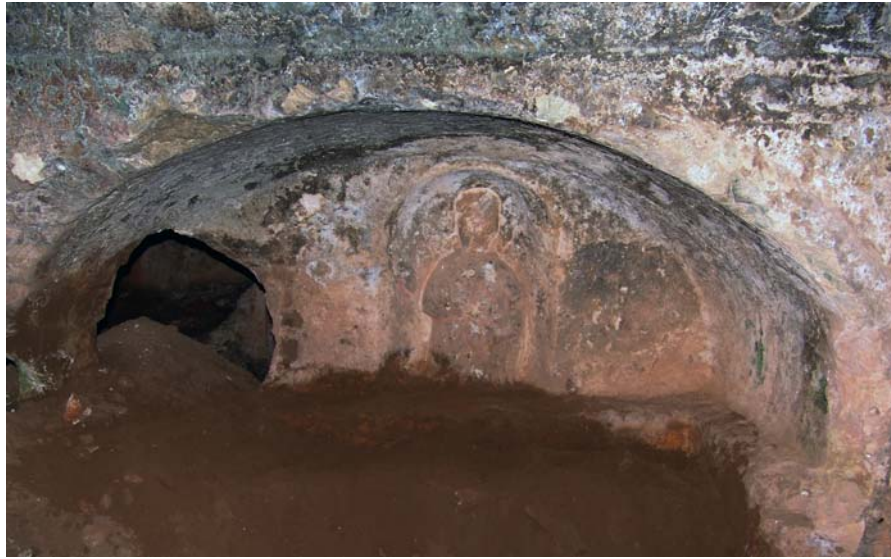
Resim 15. Kabartma Büst, KB-Mezar 1, Kuzeybatı mezar odası, Güneybatı, Khamosorion

Nişin içteki geniş yüzeyinde üst kısmı basık kemerli ve içe doğru yarım kubbe biçiminde derinleşen dikdörtgen formlu alana sahip bir kabartma pano (G: 0.60 x 0.83 m) mevcuttur. Kabartmalı alanda giyimli bir erkek büstü görülmektedir (Kabartma K: 0.20 m; Resim 15). Baş ezilmiş ve kırılmış, gövdenin üst kısmı cepheden betimlenmiş, omuzlar düşük, sağ kol manto içerisinde gövdeye yapışık ve dik açılı kıvrım ile bel hizasında, sol kol yanda omuzundan aşağı sarkan kumaş tomarını taşımaktadır. Stilize kumaş kıvrımlarının detayları derin, düz hatlarla belirtilmiştir.