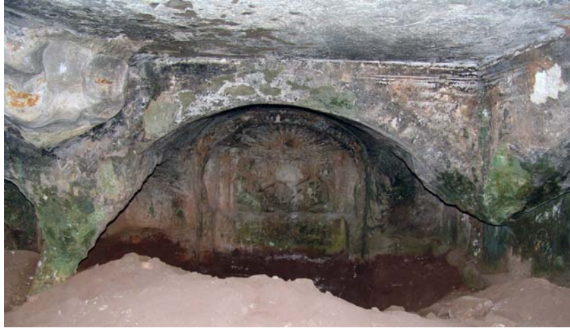
Resim 12. KB-Mezar 1, Kuzeybatı mezar odası

Nişin iç yüzeyinde kabartmalı betimler bulunmaktadır. Kuzeybatı yönündeki geniş yüzeyde dikdörtgen bir panoda (G: 0.85 x 1.53 m) cenaze ziyafeti 24 sahnesine yer verilmiştir (kabartma Y: 0.15 m) (Resim 12). Yüzey aşınmış olup, figürlerin detayları belirsizdir. Bir kline üzerinde sol kolu üzerine dayanmış biçimde uzanmış, kolu dirsekten itibaren açılı biçimde kıvrılmış ve elinde bir içki kâsesi tuttuğu belirgin bir erkek görülmektedir. Baş tamamen tahrip olmuştur. Gövdenin üst kısmı cepheden, sol bacak ileride, sağ bacak giysi altında geniş açı yapacak biçimde geri çekilmiştir. Sağ kol gövdeye yapışık olup, omuzdan itibaren öne ve ileri doğru uzanmaktadır. Gövdenin sağ yarısını açıkta bırakan mantonun geniş kumaş tomarı dışında giysi detayları belirsizdir. Bu figürün ayakucunda aynı klinenin kenarına oturmuş, himation ve omuzlarını örttüğü 25 manto giyimli, mantosunun ucunu sol eli ile tutmuş, gövdesi 2/3 sağ profilden bir kadın tanımlanmaktadır. Baş tamamen tahrip olmuştur. Gövde yüzeyi sol yarıda tabaka halinde kırık ve eksiktir. Yüzey ise yosun kaplıdır. Kabartma yüzeyinde yeni tahribatlar da söz konusudur.