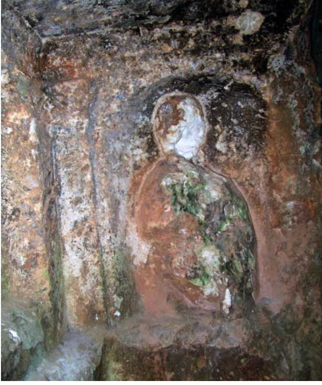
Resim 13. Kabartma Büst, KB-Mezar 1, Kuzeybatı mezar odası, Kuzeybatı Khamosorion

Nişin kuzeydoğu dar yüzeyinde üst kısmı basık kemerli ve içe doğru yarım kubbe biçiminde derinleşen dikdörtgen bir pano oluşturulmuştur (G: 0.60 x 0.83 m). Figür ayrıntılı tanımlanamayacak şekilde tahrip edilmiştir. Mevcut kalıntılar, bir büst kabartmasının ancak dış konturunu belirlemeye yardımcı olmaktadır (Resim 13).