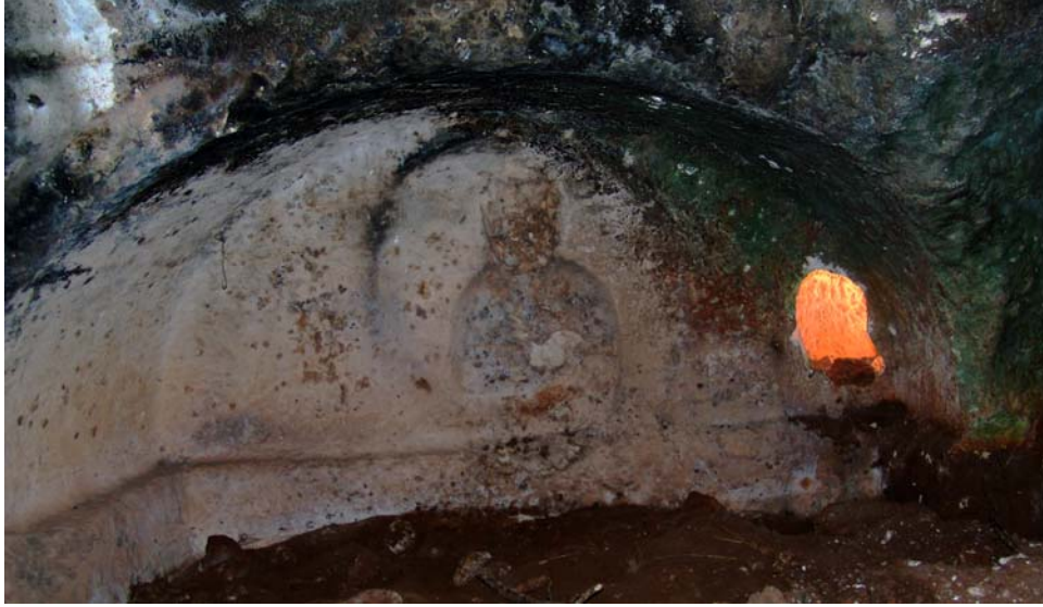
Resim 20. KB-Mezar 1, Güneybatı mezar odası

Mezar nişlerinin formu ve işçiliği birbiriyle yakın benzerliklere sahiptir. Nişlerin kemer alınları dış bükey profillere sahip silmeler ile çerçevelemiştir. Gömüler nişlerde bulunan boyuna kesitleri dikdörtgen formlu lahitlere yapılmıştır 26 . Lahitler diğer mezar odalarında olduğu gibi nişlerin içini tamamen kaplayacak şekilde aynı kayadan oyulmak suretiyle meydana getirilmiştir.