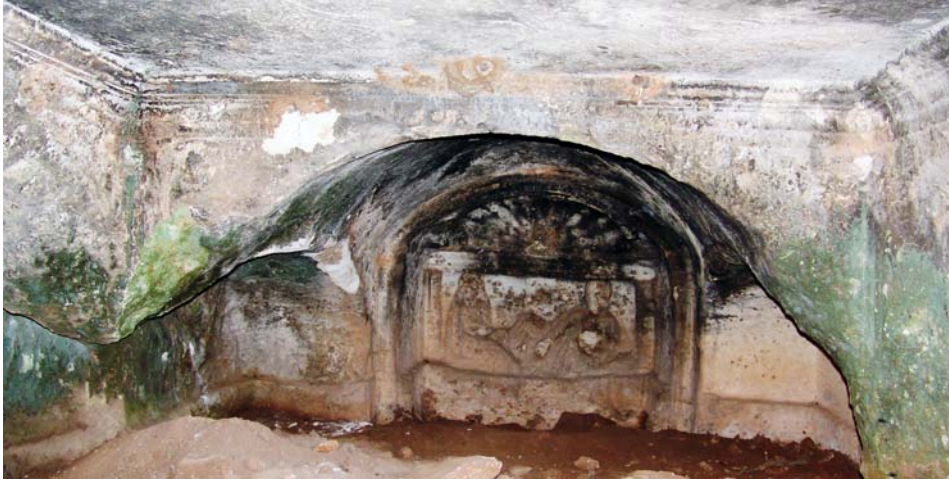
Resim 17. KB-Mezar 1, Kuzeydoğu mezar odası

Nişin kuzeydoğu yönündeki ana cephesinde dikdörtgen bir panoda (G: 0.87 x 1.80 m) cenaze ziyafeti sahnesine yer verilmiştir (kabartma Y: 0.14 – 0.15 m). Yüzey aşınmış olup, figürlerin detayları belirsizdir (Resim 17). Bir kline üzerinde uzanmış erkek ve bunun karşısında aynı klinenin kenarına oturmuş kadın motifleri kuzeybatı mezar odasında tanımlanan kompozisyonu tekrarlamaktadır.