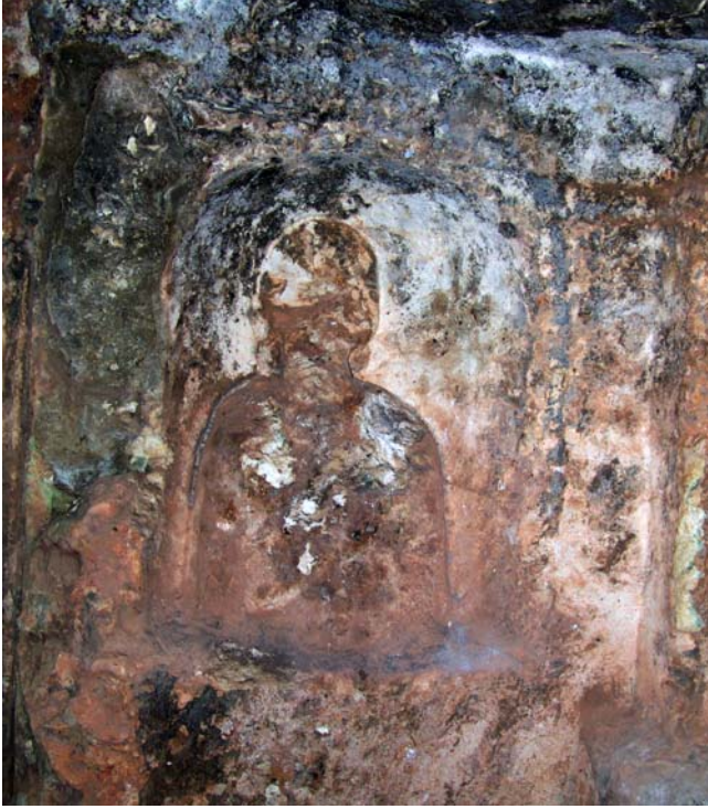
Resim 14. Kabartma Büst, KB-Mezar 1, Kuzeybatı mezar odası, Khamosorion

Nişin içteki geniş yüzeyinde üst kısmı basık kemerli ve içe doğru yarım kubbe biçiminde derinleşen dikdörtgen formlu alana sahip bir kabartma pano (G: 0.60 x 0.83 m) mevcuttur. Kabartmalı alanda giyimli bir erkek büstü görülmektedir (Kabartma K: 0.20 m; Resim 15). Baş ezilmiş ve kırılmış, gövdenin üst kısmı cepheden betimlenmiş, omuzlar düşük, sağ kol manto içerisinde gövdeye yapışık ve dik açılı kıvrım ile bel hizasında, sol kol yanda omuzundan aşağı sarkan kumaş tomarını taşımaktadır. Stilize kumaş kıvrımlarının detayları derin, düz hatlarla belirtilmiştir.