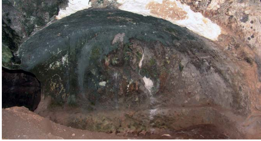
Resim 18. Kabartma Büst, KB-Mezar 1, Kuzeydoğu mezar odası, Kuzeybatı

düşük işlenmiştir. Sağ kol manto içinde, el sol göğüs altındadır. Sol kol detayı tanımlanamamaktadır.