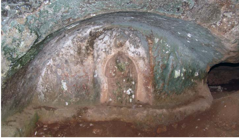
Resim 16. Kabartma Büst, KB-Mezar 1, Kuzeybatı mezar odası, Kuzeydoğu, Khamosorion

Nişin iç geniş yüzeyinde üst kenarı kemerli bir pano (G: 0.60 x 0.93 m) içerisinde detayları tanımlanamayacak biçimde tahrip edilmiş bir erkek betimi görülmektedir (Kabartma K: 0.12 m; Resim 16).