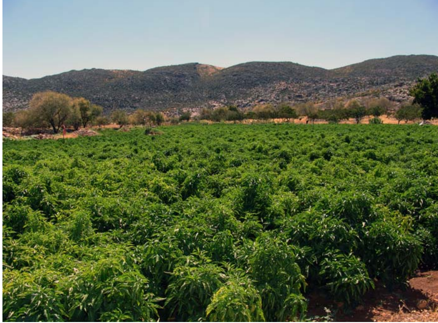
Resim 2. Güneydoğu Nekropol alanı, Güneydoğu'dan

incelenen iki nekropol alanı ve bu nekropollerde içine girilebilen iki mezar yapısı ayrıntılı biçimde ele alınmıştır.