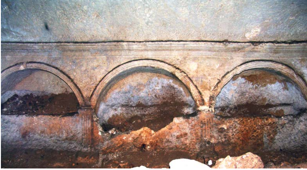
Resim 7. GD-Mezar 1, mezar odasının Kuzeybatı cephesi