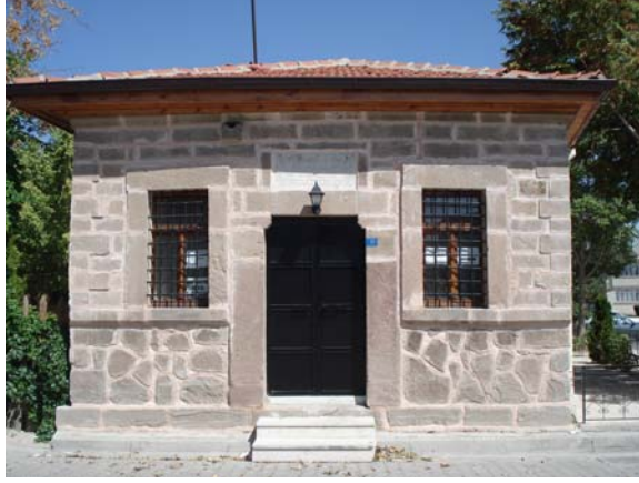
Fotoğraf 1. Ferhuniye Dârü'l-Huffâzı Manzumesi'nden ayakta kalan türbe kısmı.

Ferhuniye Dârü'l-Huffâzı'na gelir olarak Konya'nın Sahra Nahiyesi'ne bağlı Kayseroğlanı ve Ekizce köyleri, Belviran'a bağlı bir köy, Seydişehir'e bağlı Şekerarmut köyü ile İsmil Çiftliği, Larende'ye bağlı Dutsa ve Kızılca köyleri, Konya'da Selyığar Çayı yakınlarındaki tarla ile Salur'daki başka bir tarla vakfedilmiştir 113 .