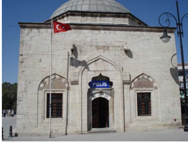
Fotoğraf 2. Hacı Ali Efendi Dârü'l-Huffâzî günümüzde karakol olarak kullanılmaktadır.

bu bina bazen muallimhane 125 bazen de dârü'l-kurrâ 126 olarak kaydedilmiştir. Bu belgelerin tarihsel süreçten takip edilmesinden anlaşılıyor ki, Küçükdağ'ın işaret ettiği üzere Kur'an kıratı okumak üzere bina edilen bu eğitim kurumuna Osmanlılar, muallimhane ve dârü'l-huffâz bölümleri de ilave ederek dârü'l-kurrâyâ öğrenci yetiştiren alt birimler oluşturma yönüne gitmişlerdir. Bu görüşü binada yapılan tadilat da desteklemektedir. Nitekim burası başlangıçta tek kubbeli geniş bir mekân iken ahşap malzeme ile dört odalı bir duruma getirilmiştir. XX. yüzyıla gelindiğinde ise bu bina medreseye çevrilmiştir 127 . Cumhuriyet sonrası dönemde Sağlık Müzesi ve Müftülük Dairesi 128 olarak da kullanılan bina günümüzde Emniyet Müdürlüğü tarafından kullanılmaktadır (Fotoğraf 2).