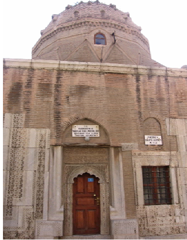
Fotoğraf 3. Hasbeyoğlu Dârü’l-Huffâzı günümüzde mescit olarak kullanılmaktadır.

Konyalı, Batılıların Karamanoğulları’ndan kalma bu estetik esere “ Ayasofya Mescidi ” dediklerini söyler ve arkasından da bunun nedeninin ayrıntılardaki ince işçilikten kaynaklandığını belirtir 137 . Gerçekten de insan kendini bu eserdeki zarif işçiliğe hayran kalmaktan alamaz (Fotoğraf 3).