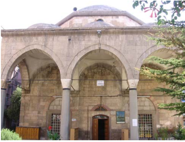
Fotoğraf 5. Nasuh Bey Dârü'l-Huffâzı'nın bulunduğu manzumenin bugün ayakta kalan mescit kısmı.

Kitabesi bulunmayan Nasuh Bey Dârü'l-Huffâzı, kare bir plan üzerine kesme taşlardan yapılmış, tek kubbeli bir Karamanlı yapısıdır 184 . Dört yönündeki sağır kemerli sekiz büyük pencereden ışık alan eserin batısında evvelce üç kubbeli revakı varken sonradan yıkılmıştır. Geniş ferah bir eser olan Nasuh Bey Dârü'l-Huffâzı'nın batı revakı yıkıldıktan sonra, ortadaki kapısı tuğla ile örülmüş ve güneyindeki sağ penceresi kapı haline getirilmiştir. Dârü'l-huffâz, Osmanlılar devrinde bir aralık "Musabey Kütüphanesi" adıyla kitaplık, daha sonra askeri malzeme deposu ve gaz ambarı olarak kullanılmış, 1960–1961 yılları arasında Konya Eski Eserleri Sevenler Derneği tarafından orijinal şekline uygun olarak onartılmıştır 185 . Şu anda cami olarak kullanılmaktadır (Fotoğraf 5).