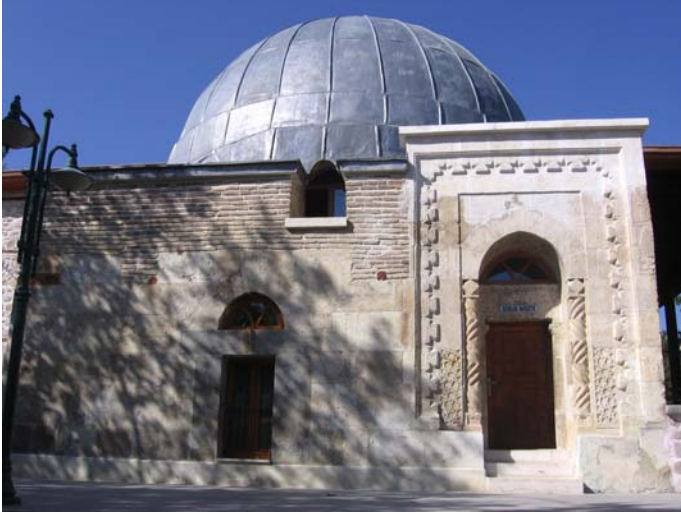
Fotoğraf 4. Meram Dârü'l-Huffâzı günümüzde mescit olarak kullanılmaktadır.