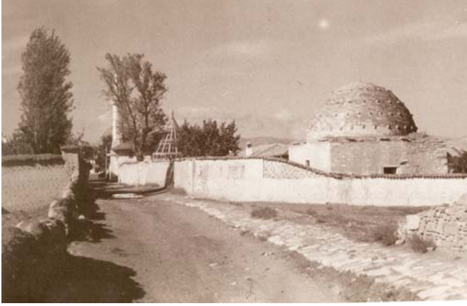
Fotoğraf 7. Turgutoğlu Pir Hüseyin Bey Türbesi/Dârü'l-Huffâzı. (geçmişten günümüze Konya fotoğraf albümü, Konya Ticaret Odası Yayını, Konya 2007)

yokken İbrahim adlı bir kişi tarafından kendisinden zorla cüzhânlık alınmış, ancak yapılan haksızlık anlaşılınca Mustafa tekrar cüzhânlık vazifesine iade edilmiştir 232 .