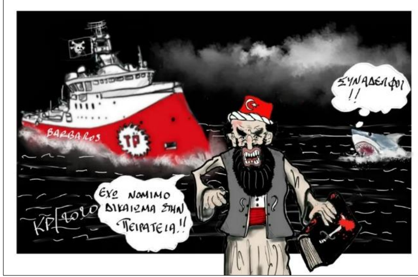
Şekil 2. Barbaros Gemisi Karikatürü

Sakal aynı zamanda Müslüman toplumlarda dindarlığı temsil etmektedir. Hellas Journal'da yer alan bu karikatürde de başında fes ve sakal bulunan ve sakallı olan kişi ile tehlikeli Müslüman imajı yaratmaya çalışarak Türkiye üzerinde algısal olarak coğrafi tahayyüller üretmektedir. Özellikle görselde tehlikeli imajını derinleştirmek adına siyah ve tonlarında renkler kullanılmıştır. Ayrıca karikatürde çizilen geminin bayrağında bulunan kurukafa, korsanlığı simgelemektedir. Karikatürde yer alan kişinin "Korsanlık yapmak benim yasal hakkım" şeklinde bir ifade bulunması Türkiye'nin bölgede resmi bir devlet olarak değil yasa dışı faaliyetlerde bulunan korsan bir devlet anlayışı içerisinde olduğu mesajı verilmektedir. Yani burada Türklerin Akdeniz'de korsanlık faaliyetlerinde buldukları algısı oluşturulmaya çalışılmaktadır. Karikatürdeki köpek balığı ise "Meslektaşlar" şeklinde konuşturularak Türkiye'nin köpek balığı gibi saldırgan davranışlarda bulunduğu vurgu yapılmaktadır.