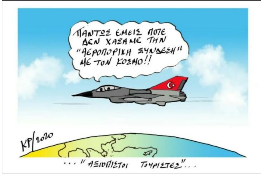
Şekil 5. Kışkırtıcı Türk Jetleri Karikatürü

Bu kapsamda incelenecek olan son karikatürde diğer karikatürde benzer özelliklerine rastladığımız kafasında fes olan, sakallı bir profil çizen ve Türkiye'yi temsil eden bir kişi bulunmaktadır (Şekil 6). Karikatürdeki bu kişinin panik ve sıkıntılı ruh hâli içerisinde olduğu görülmektedir. Mevcut karikatürün yayınladığı haberde Türkiye'de yer alan bir gazetenin yaptığı haberden yola çıkarak Türkiye'nin Yunanistan'dan intikam alacağına yönelik çıkarımlar yer almaktadır. Hatta olası bir savaşta Yunanistan ve Türkiye'nin baş başa kalacağı ve Yunanistan'a Fransa'nın ve Birleşik Arap Emirlikleri'nin yardım etmeyeceği ifade edilmektedir.