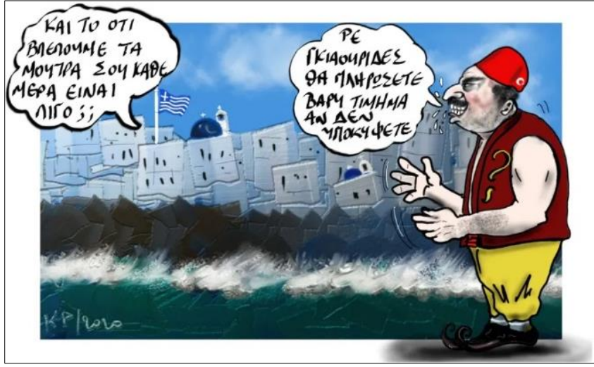
Şekil 3. Sondaj Faaliyetleri Karikatürü

Söz konusu karikatür incelendiğinde kafasında Türkiye’yi simgelediği düşünülen fes takan ve şalvar giyen bir erkek figürünün olduğu görülür. Karikatürdeki konuşma balonlarında, fesli Türk karakterinin “ Hey gavurlar, eğer teslim olmazsanız bunun bedelini ağır ödeyeceksiniz ” şeklinde bir söz var. Ona karşı olarak ise Yunan bayrağının olduğu bölümdeki konuşma balonunda “ Her gün senin yüzünü görmek az bi şey mi? Yetmez mi? ” şeklinde bir ifade yer almaktadır. Çizimden ve metinden anlaşılacağı üzere görseldeki kişi Türkiye’yi Osmanlı döneminden kalma çağ dışı bir zihniyette sahip olarak simgelemektedir. Buna göre Türkiye’yi temsil eden karakterin iki ülke arasındaki olayları bir savaş ortamı şeklinde algıladığı mesajı verilerek Türkiye’nin savaştan yana olduğu söylemsel olarak ifade edilmeye çalışılmaktadır. Bu duruma karşı olarak ise Yunanistan tarafının savaş isteğinin sık sık dile getirilmesinden sıkıldığı belirtiliyor. Böyle bir metin bütünlüğü içerisinde Yunanistan’ın savaş karşıtı, Türkiye’nin ise gerginlikten ve savaştan beslenen bir ülke olduğu tasavvuru yaratılmaya çalışılmıştır.