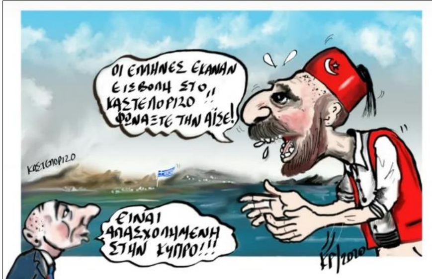
Şekil 6. Tehditkâr Türkiye Karikatürü

Bu kapsamda incelenecek olan son karikatürde diğer karikatürde benzer özelliklerine rastladığımız kafasında fes olan, sakallı bir profil çizen ve Türkiye'yi temsil eden bir kişi bulunmaktadır (Şekil 6). Karikatürdeki bu kişinin panik ve sıkıntılı ruh hâli içerisinde olduğu görülmektedir. Mevcut karikatürün yayınladığı haberde Türkiye'de yer alan bir gazetenin yaptığı haberden yola çıkarak Türkiye'nin Yunanistan'dan intikam alacağına yönelik çıkarımlar yer almaktadır. Hatta olası bir savaşta Yunanistan ve Türkiye'nin baş başa kalacağı ve Yunanistan'a Fransa'nın ve Birleşik Arap Emirlikleri'nin yardım etmeyeceği ifade edilmektedir.