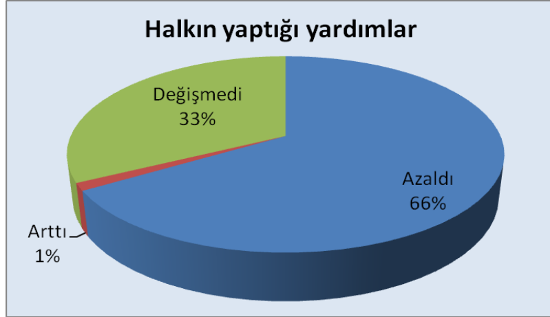
Şekil 1: Depremden sonra halkın sığınmacılara yaptığı yardımlardaki değişimler.

Sığınmacıların % 72'si depremden sonraki süreçte kendi yemeklerini kaldıkları yerlerde kendileri hazırlarken, geri kalan % 28'lik kısım Valilik, komşular veya çeşitli STK'ların dağıttığı yemeklerle beslenme ihtiyaçlarını karşılamışlardır.