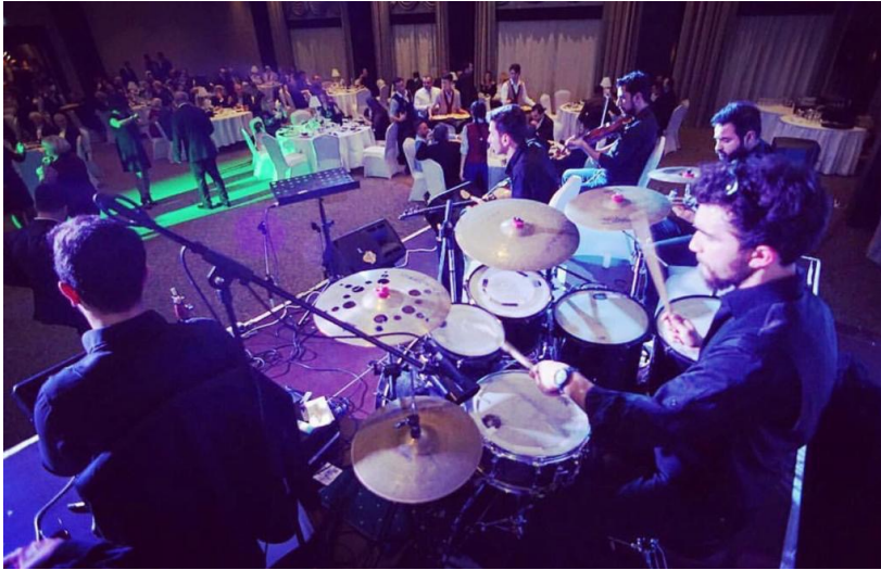
Fotoğraf 2. Safranbolu'da Modern Tarzdaki Düğünde Çalan Müzisyenler

çaldıkları enstrümanlara bakıldığında org, keman, ud, cura, kemane, kemençe, gitar, bateri, darbuka, ney gibi enstrümanlar görülmektedir. Müzik trenlerindeki değişim düğün orkestralarında da görülmektedir. 1990'lı yıllarda orgun düğünlerde kullanılmaya başlaması durumu, 2000'li yıllarda diğer enstrümanları domine ederek tek başına kullanılma halini almıştır. Ancak düğünlerde davul ve zurnanın hala devam ettiğini söylemek mümkündür (Depeli, 2009, s. 231-247).