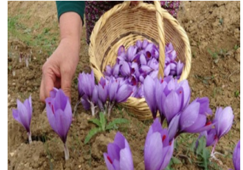
c. Safran Çiçeği