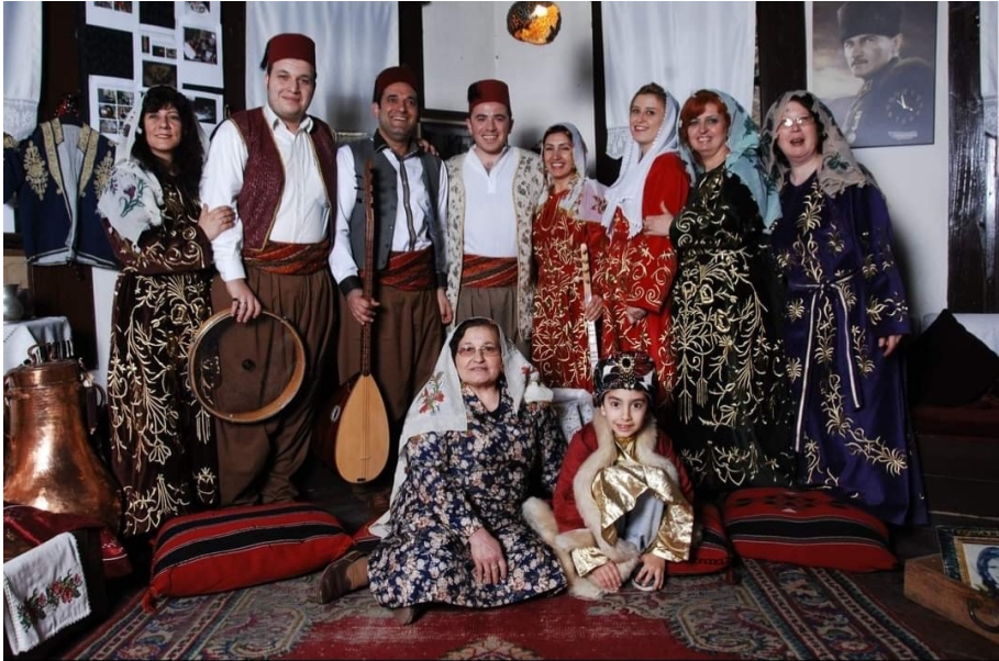
Fotoğraf 1. Safranbolu’da Düğünde Çalan Müzisyenler ve Geleneksel Kıyafetleriyle Düğüncüler