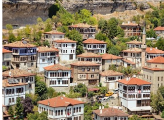
b. Tarihi Safranbolu Evleri