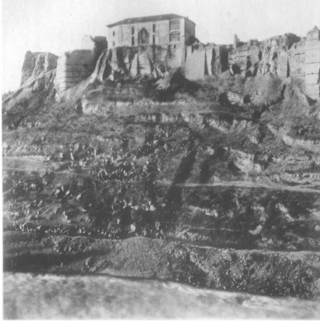
Erivan Kalesinin Zengi (Razdan) Nehri tarafından görünüşü