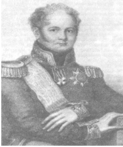
Çar I. Aleksandr