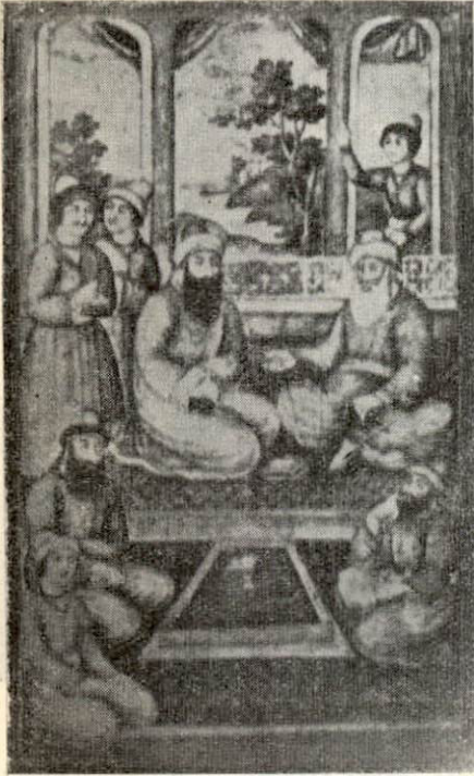
Resim : 5