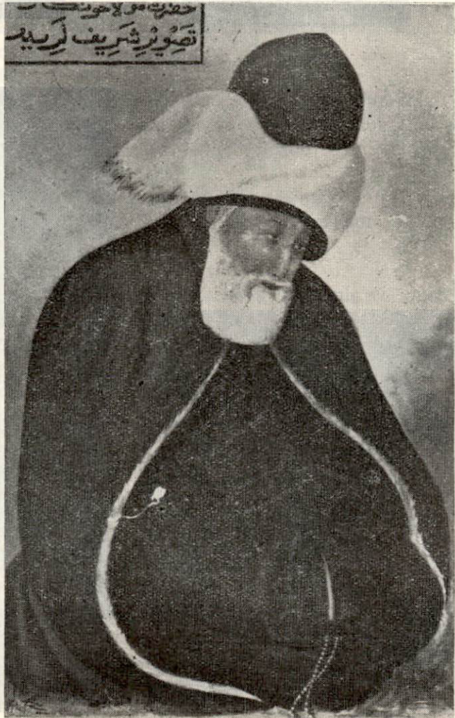
Resim : 6