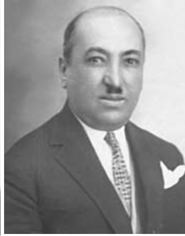
TBMM ÜÇÜNCÜ DÖNEM TBMM BEŞİNCİ DÖNEM