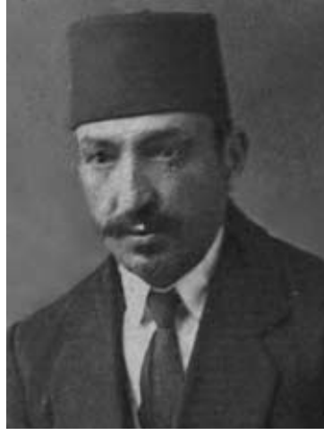
TBMM BİRİNCİ DÖNEM TBMM İKİNCİ DÖNEM