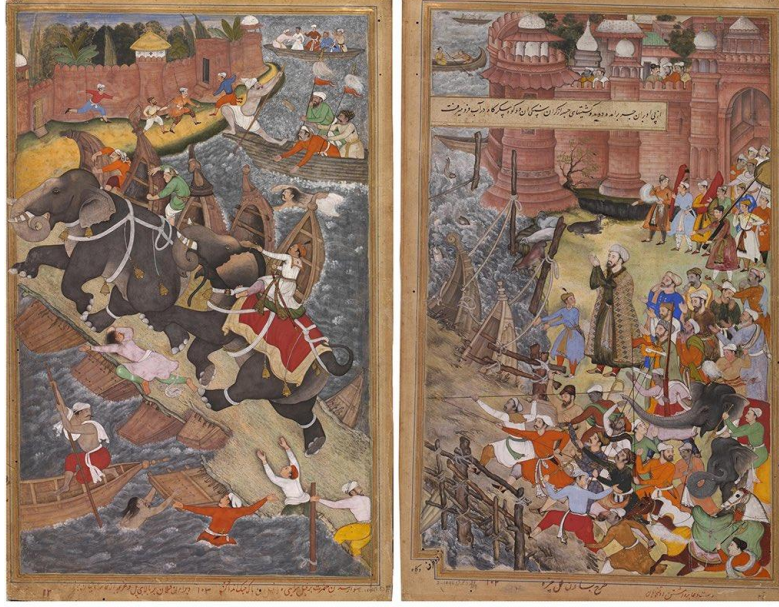
Resim 8: Nakkaş Basavan tarafından tasarlanan bu minyatürde 1561’de Ekber Şah Havai adlı fili ile Ram Bagha adlı fili dövüştürmek maksadıyla kovalamaktadır. Kaynak: “Akbarnama”, https://collections.vam.ac.uk/item/O9408/akbar-painting-basawan/ Erişim tarihi: 17.03.2022.

Bu dövüşlerde zaman zaman ölümcül kazalarda meydana gelmekteydi. Manucci’ye göre bu durum öyleydi ki filbânlar fil dövüşlerine vazifelendirildiklerinde eşleri üzerlerindeki süsleri çıkarır, altınlarını kırar ve dullar gibi yas tutar, sağ salım döndüklerinde yeni evliler gibi ziyafet verirlerdi. 77 Zira bu türden karşılaşmalarda filbânlar ve izleyenler ölümcül tehlikeler atlatırlar hatta ölürlerd. Bu tarz olaylardan biride 1633’de yaşanmıştı. 28 Mayıs 1633’de Şah Cihân cülus törenlerinin bir parçası olarak bir fil dövüşü icra edilmesini buyurdu. Bunun üzerine Sudakar ve Suratsundar adlı iki dev fil dövüşmeye başladı. Mirzalar Dârâ Şükûh, Şah Şüca ve Evrengzîb’in at sırtında izlediği bu harareti müسابaka esnasında fillerden Sudakar, Suratsundar ile olan dövüşünü bırakarak aniden mirzaların üzerine doğru yürüdü ve Mirza Evrengzîb’in atını yere serdi. Bunun üzerine mirza savrulduğu yerden ayağa kalkarak filin