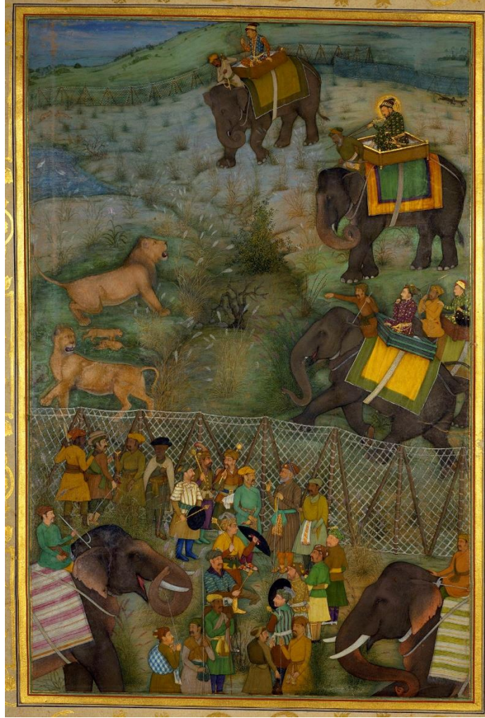
Resim 10: Şah Cihân'ı (ortada) Burhanpur'daki aslan avında gösteren minyatür.

hayvanlar iştahla kafese girerdi. Fil kafese girdiğinde nihayet gizlenmekte olan avcı, ipi keser ve kafesi kapatırdı. Daha sonra evcil dişiler, vahşi fillerin yakalandığı yere getirilir bu sayede yeni yakalanan filler bir müddet sonra evcilleşirlerdi. 89