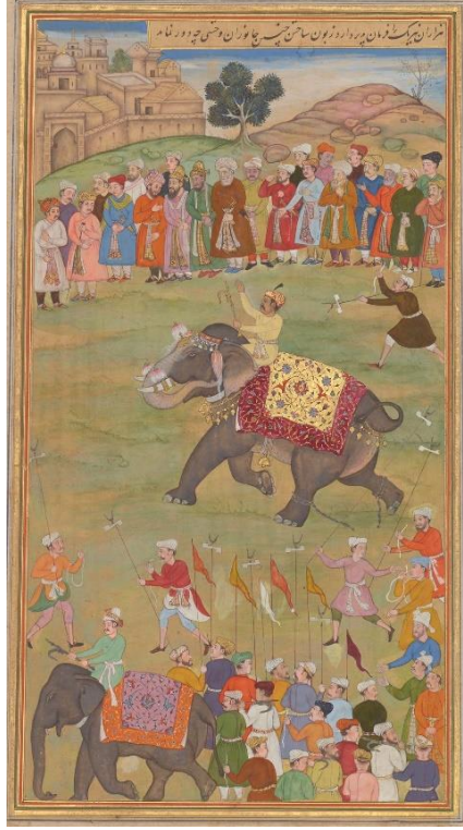
Resim 12: Ekber Şah'ın Gülkünde Sultanından hediye olarak gelen Feth-i Mübarek adlı file binmesini konu alan minyatür (Ekbernâme).