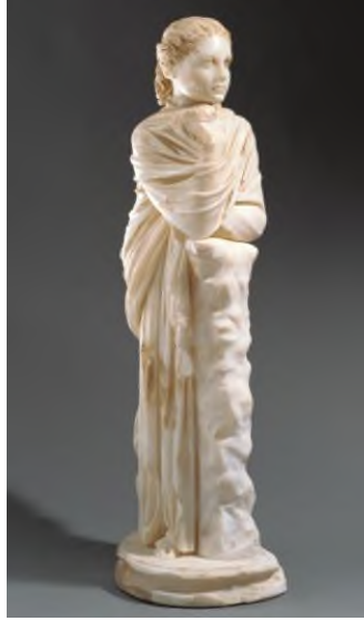
Resim 4. Kremna'dan Muse Heykeli (İlham Per. Polyhymnia - Melpomene) - J. Paul Getty Müzesi -

farklılık sergilemektedir. Ancak Muse heykellerinin toplu halde niş ve aediculalar içerisinde buldukları düşünüldüğünde, sanatçının görsel hareketliliği sağlama kaygısıyla ilham perilerini farklı vücut hareketleriyle tasarladığını söylemek mümkündür.