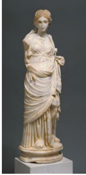
Resim 3. Kremna'dan Muse Heykeli (İlham Perisi Terpsichore) - J. Paul Getty Müzesi -