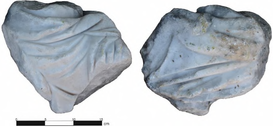
Resim 1. Kremna'dan Torso

Kent içerisinde, özellikle Hamam/Kütüphane yapısının çevresinde, çok küçük mermer parçalarına rastlanması, hem bu yapı içerisinde hem de diğer yapılarda başka heykeltıraşlık eserlerinin olabileceğini düşündürmüştür. Kentin sütunlu caddesi ve meydanında yüzeyde görülen heykel kaideleri bu kanıyı güçlendirmektedir. Öte yandan çalışma konusu torsonun kent surlarının dışında heykel parçasına rastlanması oldukça ilginçtir. Torso 2017 yılında Kremna ve Çevresi Yüzey Araştırması'nda güney surlarının hemen dışında, bir tarım arazisinde tarla sınırı için oluşturulmuş taş yığınları arasında bulunmuştur. Olasılıkla bu torso kent içerisinde yapılan kaçak kazılarda ortaya çıkmıştır. Ancak kaçak kazıcılar mantık olarak sağlam eserleri aradıkları için, kırık bir heykel parçasını uçurumdan aşağı atmaları olağandır 4 . Mermer torsonun baş, kollar ve alt gövdesi kırık ve eksiktir. Mevcut kısımda da yer yer zedelenmeler görülür. Yaklaşık olarak 0.22 x 0.27 m ölçülerindedir. (Metin, 2021, s. 312-338) (Res. 1).