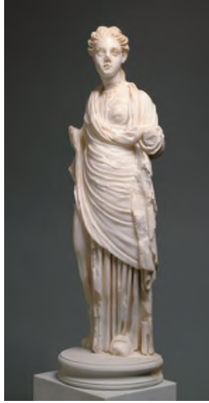
Resim 2. Kremna'dan Muse Heykeli (İlham Perisi Euterpe) -J. Paul Getty Müzesi-