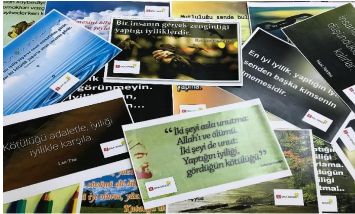
Resim 3. Okul panolarına asılan posterler

Araştırma kapsamında düşünür ve fikir adamlarına ait özlü sözler seçilmiş poster yapılarak okul panolarına asılmıştır (Resim 3).