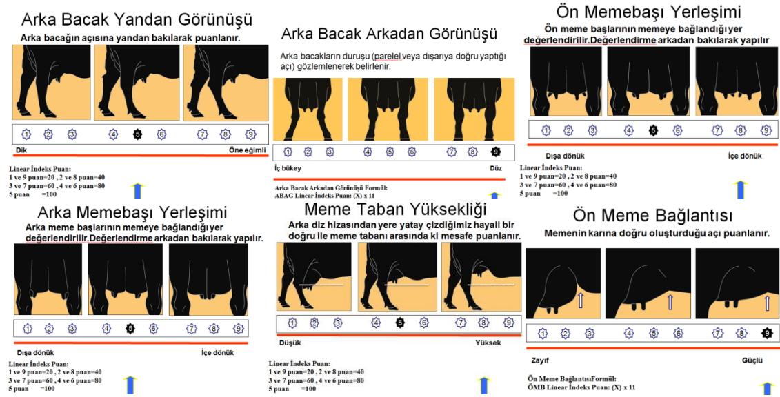
Şekil 1. Anadolu Mandası ineklerinde linear tip dış yapı değerlendirme vücut ölçüm noktaları