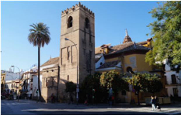
Fotoğraf 13: Santa Catalina Kilisesi ve çan kulesi, Sevilla, 14. yüzyıl.