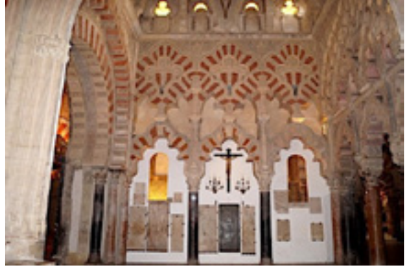
Fotoğraf 16: Kurtuba Ulu Camii'nin katedrale çevrilen bölümü, 8. yüzyıl sonu