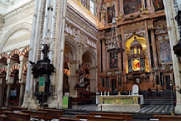
Fotoğraf 15: Kurtuba Ulu Camii'nin katedrale çevrilen bölümü, 8. yüzyıl sonu