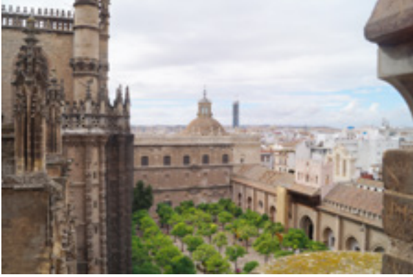
Fotoğraf 2: İşbiliye Ulu Camii avlu kalıntısı, Muvahhidler dönemi (1172-1182).