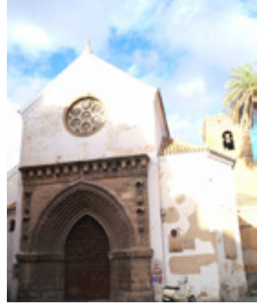
Fotoğraf 12: Santa Catalina Kilisesi portalı, Sevilla, 14. yüzyıl.