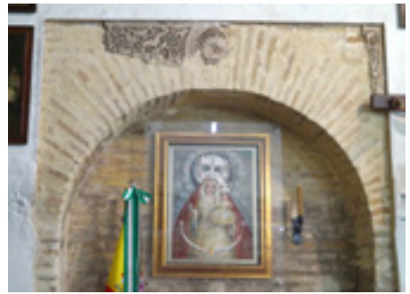
Fotoğraf 6: Omnium Sanctorum Kilisesi, kemer alınlığında İslam dönemi bezeme kalıntıları, Sevilla, 13. yüzyıl.