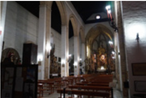
Fotoğraf 5: Omnium Sanctorum Kilisesi iç mekan, Sevilla, 13. yüzyıl.