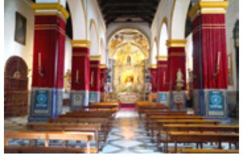
Fotoğraf 10: San Juan de Palma Kilisesi, orta nef, Sevilla, 1478.