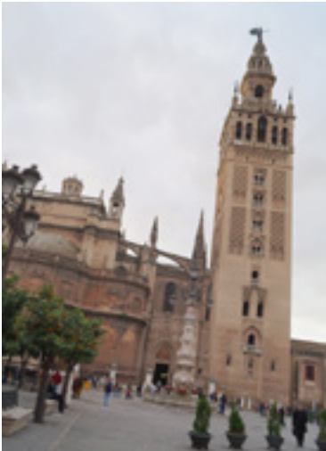
Fotoğraf 1: Giralda minaresi, 1184 ve İşbiliye Ulu Camii yerine inşa edilen Sevilla Katedrali, 1401.

Kentin farklı yerlerindeki cami ve mescitler Repartimiento de la ciudad belgeleri hazırlanmadan (1250 yılından) önce, muhtemelen belediyelere mülk olarak paylaştırılmıştır (Deimann, 2012, s. 192). Cuma camisi olarak bilinen İbn Adabbas Camii'nin (Endülüs Emevileri, 829-830) yerine Salvador Kilisesi inşa edilmiştir. Minare kalıntıları günümüzdeki Salvador Kilisesi'nde hâlâ korunmaktadır. Salvador Kilisesi yerinde bulunan cami, yeni kilise inşasının başladığı 1671 yılına kadar ayakta kalmış ve aynı yılda yıktırılmıştır.