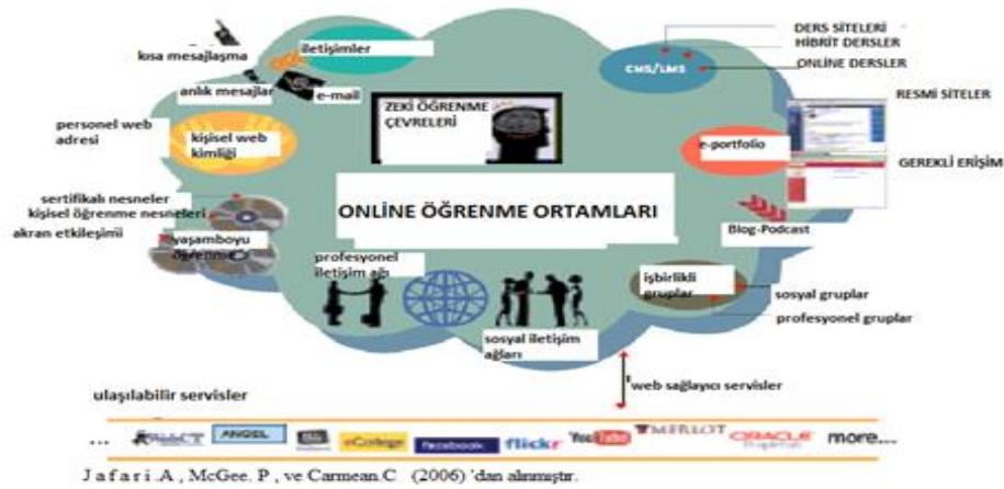
Şekil. Online öğrenme ortamları (Jafari ve Carmean 2006'dan alınmıştır) (Figure 1. Online learning environments (Figure taken from Jafari and Carmean 2006))

Okuldaki derslerde kullanılan teknoloji ile birlikte ders dışı etkinliklerinde web destekli çalışmaların kullanılması derse destek olacak niteliktedir. Hura (2011), yaptığı benzer çalışmada online etkileşimli tartışma yöntemini 66 öğrenci ile başlatmış olduğu çalışmada toplam 33 öğrencinin görüşlerine başvurmuştur. Bu öğrenciler ile toplam 7 haftalık yürütülen dersler online tartışma grubunda devam ettirilmiştir. Öğrencilerin görüşleri nitel değerlendirmeye alınmıştır. Geçer'in (2013), harmanlanmış öğrenme ortamlarında öğretim elemanı-öğrenci iletişimi konusunda yaptığı çalışmada derse giren öğrencilerin durumu ile öğretmen arasındaki etkileşim araştırılmıştır. Çalışmada, ayrıca, matematik öğretmenliği dördüncü sınıf öğrencilerine yarı yapılandırılmış anket soruları sorulmuş ve kendi öğrenme sorumluluklarını bilen araştırmacıların aktif bakış açısına sahip oldukları tespit edilmiştir.