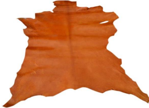
Fotoğraf 26. Karacasu'da üretilen sahtiyan deri (Image 26. Sahtiyan leather produced in Karacasu)

Sahtiyan deri, keçi derilerinin bitkisel tanenler kullanılarak çeşitli usullerde tabaklanması ile elde edilen, tabii renkli veya boyanmış yumuşak mamul deri türüdür (Anonim, 1965b:1). İnce ve cilalı olan sahtiyan derilerinin en çok ayakkabı ve çizme yapımında kullanıldığı Topkapı Sarayı pabuç koleksiyonunda görülmektedir (Özdemir ve Kayabaşı, 2007:80). Karacasu deri işletmelerinde üretilen sahtiyan deriler bavul, çanta, cüzdan, terlik, şapka (Bkz. Fotoğraf:26-27-28-29-30-31) ve süs eşyaları üretimi ile semerlik deri imalatında kullanılmaktadır (Onbeş, M. (10.06.2016)).