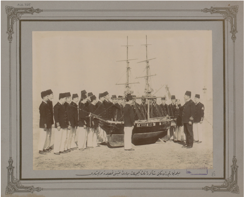
Resim 6. Leyli Tüccar Kaptan Mektebi öğrencileri gemicilik dersinde [tarih belirtilmemiş]. İstanbul Büyükşehir Belediyesi Atatürk Kitaplığı, Alb. 73-05.

Yukarıdaki tablolarda, okulda uygulanmış olan ders programı yer almıştır. Bu programın, nizamnamede belirlenen programdan farklı olduğu görülmektedir. Nizamnamede birinci sınıftan başlayarak dört yıl boyunca ‘Ameliyat-ı mellahiye’ adı ile yer alan, denizcilik uygulamalarına dayalı pratik dersin, programa ya da umumi imtihanlar arasına hiç girmediği anlaşılmaktadır. Programda ‘Gemicilik’ olarak yer alan dersin ise asıl olarak ‘Gemicilik Fenni’ yani teorik bir ders olma ihtimali daha büyüktür. Nizamnamede olduğu halde dört yıl boyunca programa hiç girmemiş başka bir ders ise ‘Rumca’dır. Derslerden alınabilecek en yüksek puan 45 olarak belirlenmiştir. Sadece ‘Ayak talimi/Jimnastik’ ve ‘Resim’ dersleri 20 puan üzerinden değerlendirilmiştir. Nizamnamede, özellikle ikinci sınıftan itibaren denizcilikle ilgili ders yoğunluğunun artması, öğrencilerin denizcilığe çok iyi hazırlanmasının amaçlandığını göstermektedir. Buna karşılık uygulamada aynı sistem takip edilmemiştir. Okulda uygulanan programda üçüncü ve dördüncü sınıflarda denizcilığe dair derslerin sayısı artsa da, nizamnamedeki yoğunluğun yakalanamadığı görülmektedir. Belki de bu nedenle eğitimi zayıf kalan okulun mezunları bir süre sonra iş bulmakta zorlanmış ve hatta girdikleri sınavları veremeyip, gedikli sınıfına dahi geçememişlerdir.