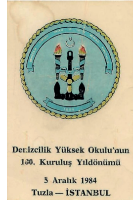
Ek 1. Yüksek Denizcilik Okulu'nun 1984 yılında kuruluş yıl dönümü için bastırıldığı hatıra zarfı ve kartı. Belge No: 8.