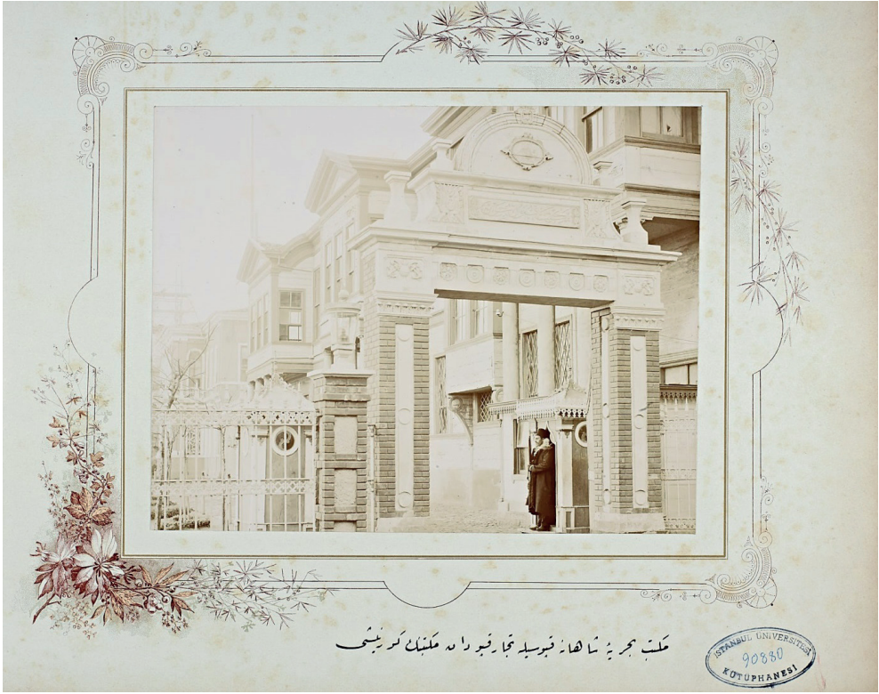
Resim 3. Bahriye Mektebi giriş kapısından Tüccar Kaptan Mektebi görünüşü [tarih belirtilmemiş]. İstanbul Üniversitesi Nadir Eserler Kütüphanesi, II. Abdülhamid Han Fotoğraf Albümleri, erişim 29.03.2022, http://nek.istanbul.edu.tr:4444/ekos/FOTOGRAF/90880---0001.jpg