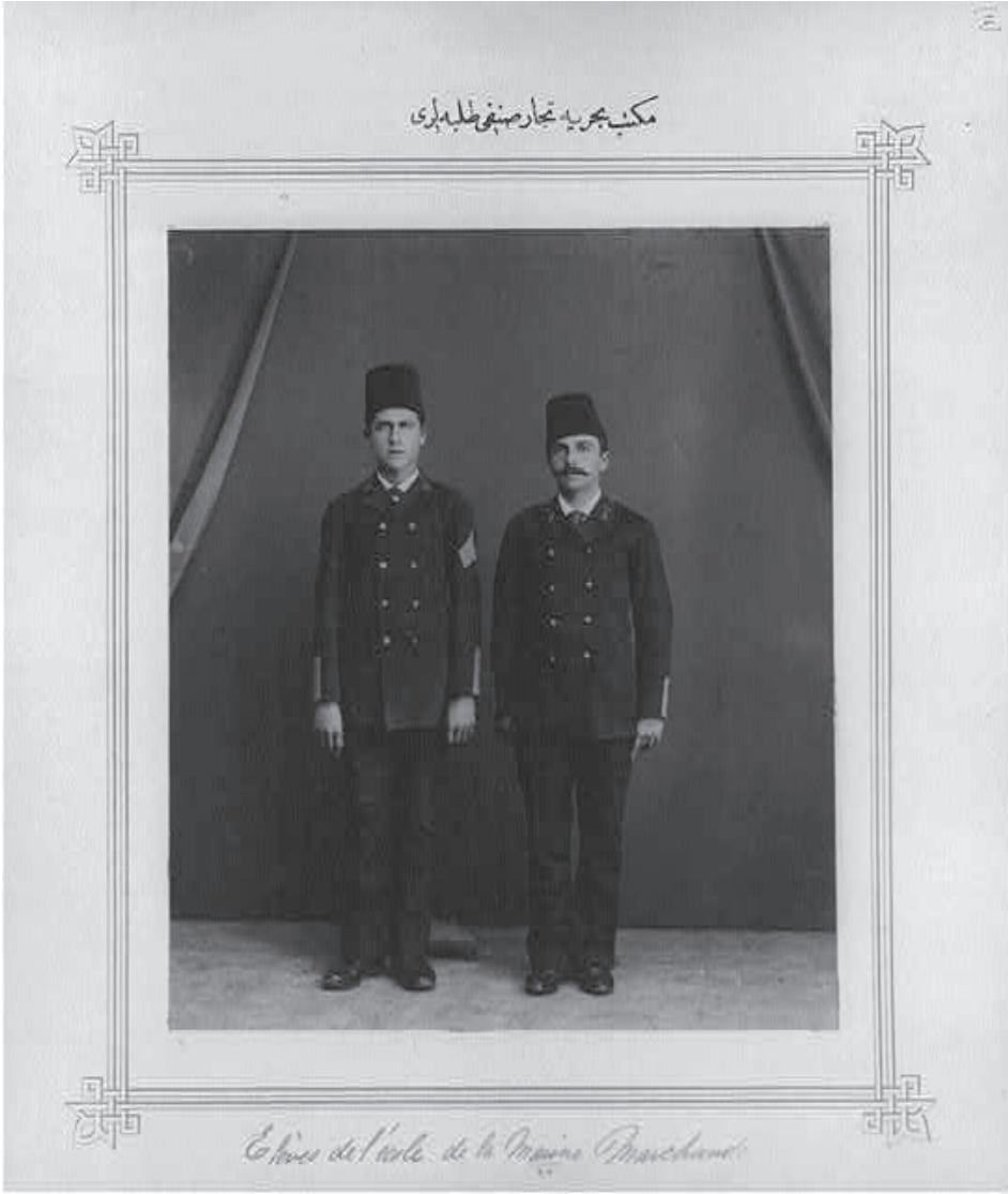
Resim 7. Bahriye Mektebi tüccar sınıfı öğrencileri [tarih belirtilmemiş].

alınınca herkes bunu bir aşağılama ve küçümseme olarak görmüştür. 93 Bunun üzerine bir de mezunların İdare-i Mahsusa vapurlarında ser taifelik [baş tayfa] yapılması kararı alınmıştır. Bu durum, diplomalı bir efendi kaptana nefer muamelesi yapılması anlamına gelmektedir.