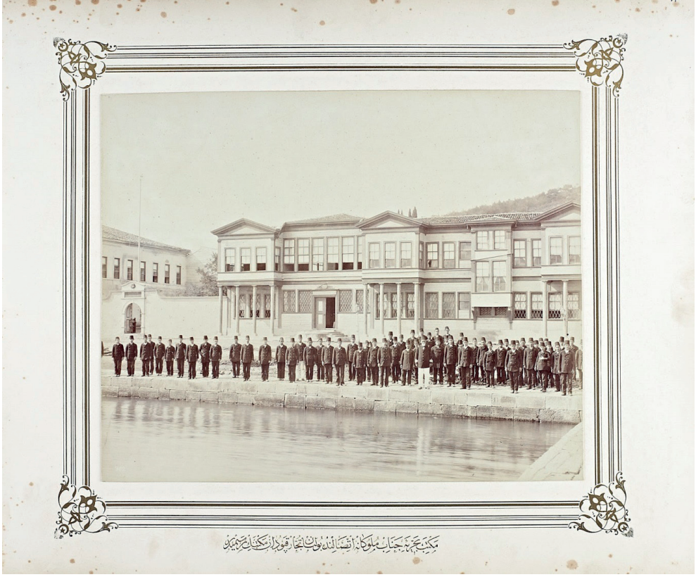
Resim 2. Bahriye Mektebi bitişiğindeki Tüccar Kaptan Mektebi [tarih belirtilmemiş].