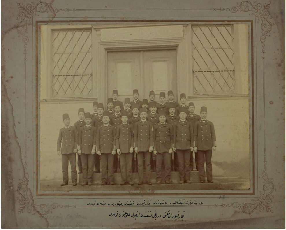
Resim 5. Tüccar Kaptan Mektebi mezunları [tarih belirtilmemiş].

Okuldaki sosyal hayatla ilgili olarak az da olsa bazı bilgilere ulaşılmıştır. Bunlardan biri, bütün diğer bahriye okullarının öğrencileriyle beraber Leyli Tüccar Kaptan Mektebi öğrencilerinin de yaz döneminde Kağıthane’de düzenlenen ziyafetlere katılmış olduğudur. Mekteb-i Bahriye-i Şahane ve Leyli Tüccar Kaptan Mektebi ile beraber Mekteb-i Rüşdiye-i Bahriye öğrencileri bu ziyafetlere katılmışlardır. 61 Okulda gerçekleştirilen bir başka önemli faaliyet sünnet olmamış öğrencilerin sünnet ettirilmesidir. 62 Öğrencilere tanınan başka bir imkân da umumi imtihanlarını bitiren öğrencilerden isteyenlere, Ramazan Bayramını ailelerinin yanında geçirmek üzere sıralarına gitme izni verilmiş olmasıdır. 63