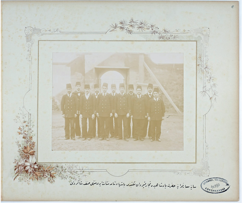
Resim 4. Tüccar Kaptan Mektebi mezunları [tarih belirtilmemiş].