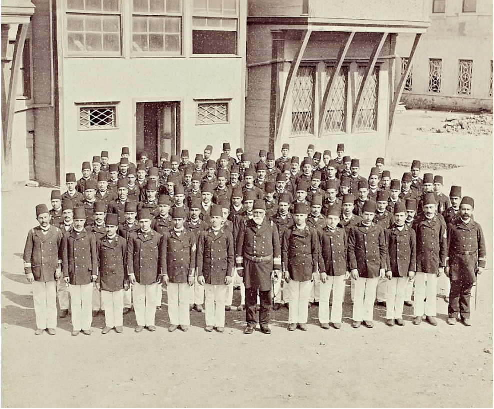
Resim 1. Leyli Tüccar Kaptan Mektebi'nin ilk sınıfı Mektep Nazırı Tayyar Paşa ile [tarihsiz]. Fevzi Kurtoglu, "Deniz Mektebinin Tarihine Bir Bakış," Deniz 18 (1 Birinci Kânun 1936): 11.

Okul ile ilgili bilgilere ulaştığımız bir başka belge çeşidi de İmtihan-ı Umumi Cetvelleri 'dir. Bunlar içinde en eski tarihli "1305 sene-i tedrisiyesi Mart'ına kadar" görülen derslerden alınan sınav notlarını gösteren cetveldir. 28 Bu ifade, cetvelin içerdiği sınav notlarının 1304 Rumi yılına ait olduğunu ifade etmektedir. Ayrıca cetvel, sadece birinci ve ikinci sınıf notlarını içerdiği için okulun Rumi 1303 / Miladi 1887-88 eğitim yılında açıldığını bir kez daha ortaya koymaktadır.