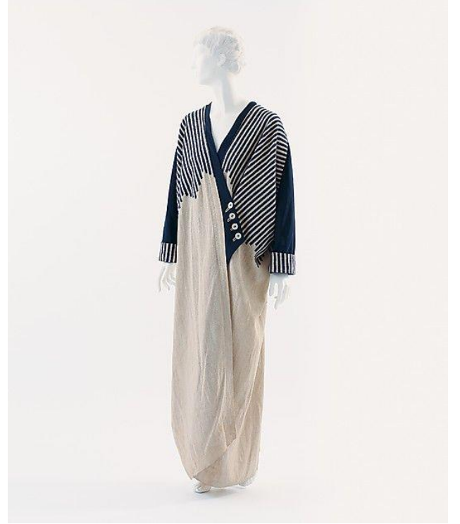
Resim 3. Paul Poiret, "Fovizm, Kübizm etkileri taşıyan Oryantalist tasarım", 1913, omgthatdress.tumblr.com, ( https://tr.pinterest.com/pin/516858494709779937/ ) /