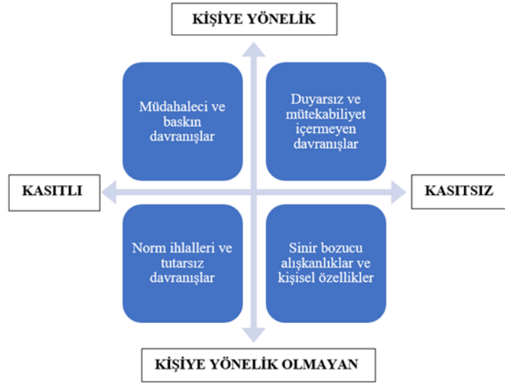
Şekil 1: Sosyal Alerjenlerin Sınıflandırılması

Müdahaleci ve baskın davranışlar: İlk sosyal alerjen türü olup, temel olarak bireye yönelik ve kasıtlı gerçekleştirilen kaba, aşağılayıcı, sürekli eleştiren, kontrol edici ve saygısız kişisel davranışları içerir (Cunningham, 2009, s. 1512). En açık şekliyle başarı ya da statüyle açıkça övünme ve küstah güç gösterilerinden, daha örtük şekilde gerçekleştirilen istenmediği halde tavsiyelerde bulunmaya ve yardım teklif etmeye kadar uzanır. Normal olarak nitelenen yakın ilişkilerde de müdahaleci davranışlar oldukça yaygındır (Lavy, Mikulincer, Shaver ve Gillath, 2009). Arkadaşlık ilişkilerinde dahi kişinin otonomisini kısıtlayan düşüncesiz ve istenmeyen tavsiyelerde bulunmanın ilişkilerdeki stresi arttırabileceği saptanmıştır (Goldsmith ve Albrecht, 2011).