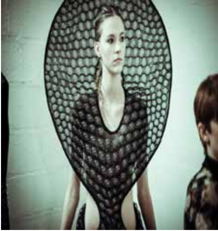
Resim 3. Iris Van Harpen, 2014.

İç mimar Thom Forsyth'un kağıt malzeme kullanarak tasarladığı 'The Modern Ruff' adlı çalışmasında, sanatçının eserine verdiği ismin de belirttiği gibi özellikle ruff yakasının izlerini görmek mümkündür. İşlevselliğinden tamamen uzaklaşarak bir sanat objesi olarak 'Pratt + Paper & Ralph Pucci'de sergilenen 3 boyutlu ve hacimli bu sanatsal yaka, bilinen yaka formunun aksine yalnızca boyun çevresinde yer almamış aynı zamanda vücuda dolanarak farklı bir yapıya bürünmüştür (Resim 4).