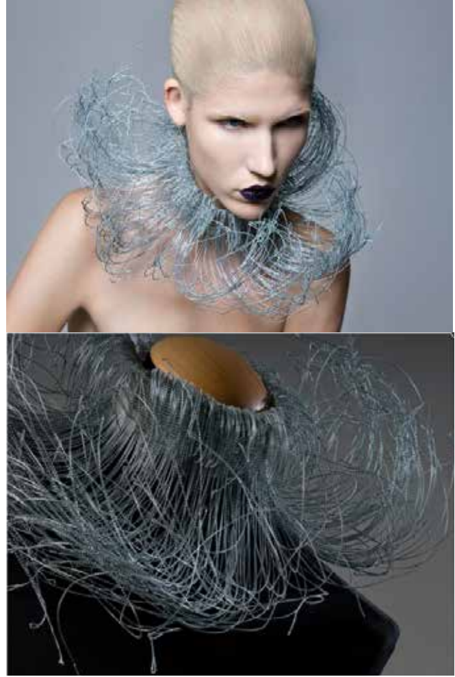
Resim 7. Silvia Beccaria, 'Futura', 2009, 'Natura/Ruff' koleksiyonundan.

İtalyan sanatçı Silvia Beccaria, tel, pamuk ve kauçuk gibi farklı malzemeler kullanarak tapestry dokuma tekniğiyle oluşturduğu sanatsal çalışmalarında tarihsel ruff yaka formunu oldukça soyut bir görünüme kavuşturmuştur. Klasik anlamıyla bir giysi detayı olarak bilinen yaka kavramı Beccaria'nın tasarımlarında çok farklı bir boyuta geçerek gerek kullanılan malzemesi gerek heykelsi formuyla adeta sanatsal bir takı haline gelmiştir. Silvia Beccaria 'Futura' ve 'Mora d'Inverno' adlı sanatsal çalışmalarında ruff yakayı öylesine farklı bir boyuta büründürmüştür ki, sanatçının koleksiyona verdiği isim ve ifadesi olmasa ruff yaka ile özdeşleştirmek neredeyse imkansızdır (Resim 7, Resim 8).