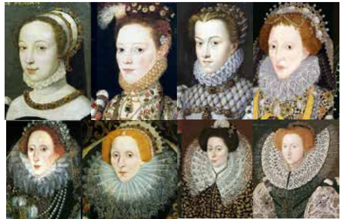
Resim 1. Rönesans Dönemi’nde ruff yaka formunun değişim ve gelişim süreci.

Ruff yakanın kökeni, 14. yüzyıldan 16. yüzyıla uzanan Rönesans Dönemi’ne dayanmaktadır. “Rönesans döneminin ilk yıllarında gömlek ya da kısa bluzun yakasının dantelli kenar süsleri olarak ortaya çıkmıştır. Bu küçük dantel yaka 1550’lerden itibaren yavaş yavaş gelişmiş, 1575’ten sonra geniş, bağımsız, devasa bir yaka halini alarak Rönesans giysilerine çok daha ihtişamlı bir görünüm kazandırmıştır.” (Boucher, 1987: 240) (Resim 1).