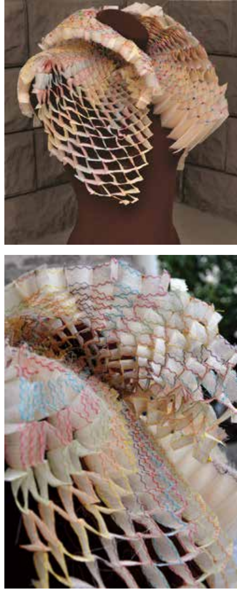
Resim 10. Giyilebilir sanat bağlamında tasarlanan kişisel ruff yaka çalışması, 'Ritim/Rhythm' (makine ve el dikişi, özgün teknik; tela, dikiş ipliği), Meltem Ok, 2008.

Şeritler halinde kesilen keten kumaş parçalarının belli bir sistemle katlanıp birleştirilmeleriyle oluşturulan 'Ritim/Rhythm' adlı yaka çalışmasında açık ruff yakanın genel silüeti oluşturulmaya çalışılmıştır. Parçaların kenarlarındaki zigzag dikişler ruff yakalarda kullanılan işlemlere gönderme yaparken, el dikişleriyle oluşturan renkli toprak yine ruffların bezenmesinde kullanılan değerli taşları simgelemektedir (Resim 10).