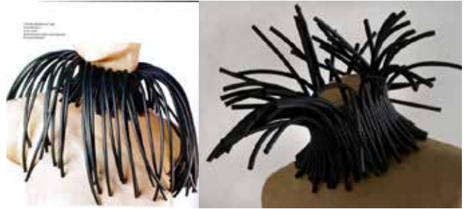
Resim 8. Silvia Beccaria, 'Mora d'Inverno' 2008, 'Gorgiera/Ruff' koleksiyonundan.