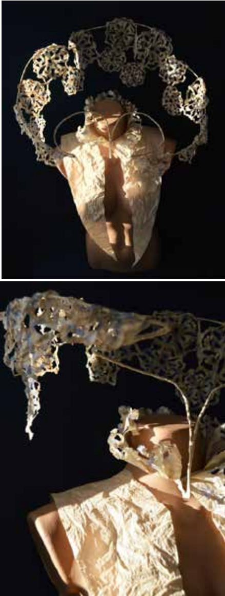
Resim 9. Giyilebilir sanat bağlamında tasarlanan kişisel ruff yaka çalışması, 'Dantel/Lace', (el boyama, özgün teknik; tela, tel, dikiş ipliği), Meltem Ok, 2015.

özgün yaka çalışmasının genel silüetinin oluşumunda, Rönesans dönemi ruff yakalarını çok daha görkemli bir görünüme kavuşturmak için arkalarına takılan tel desteklerden ilham alınmıştır. Telden oluşturulan soyut ruff yaka silüeti, dantel görünümü verilmeye çalışılan büyüklü küçüklü parçalarla bezenmiştir. Telanın kesilip şekillendirilmesiyle oluşturulan parçalar el boyama ve el dikişleriyle dantel görünümüne kavuşturulmuştur. Bu şekilde ruff yakalara yapılan işlemler ve o dönemlerde kullanılan dantelin zarafeti vurgulanmaya çalışılmıştır (Resim 9).